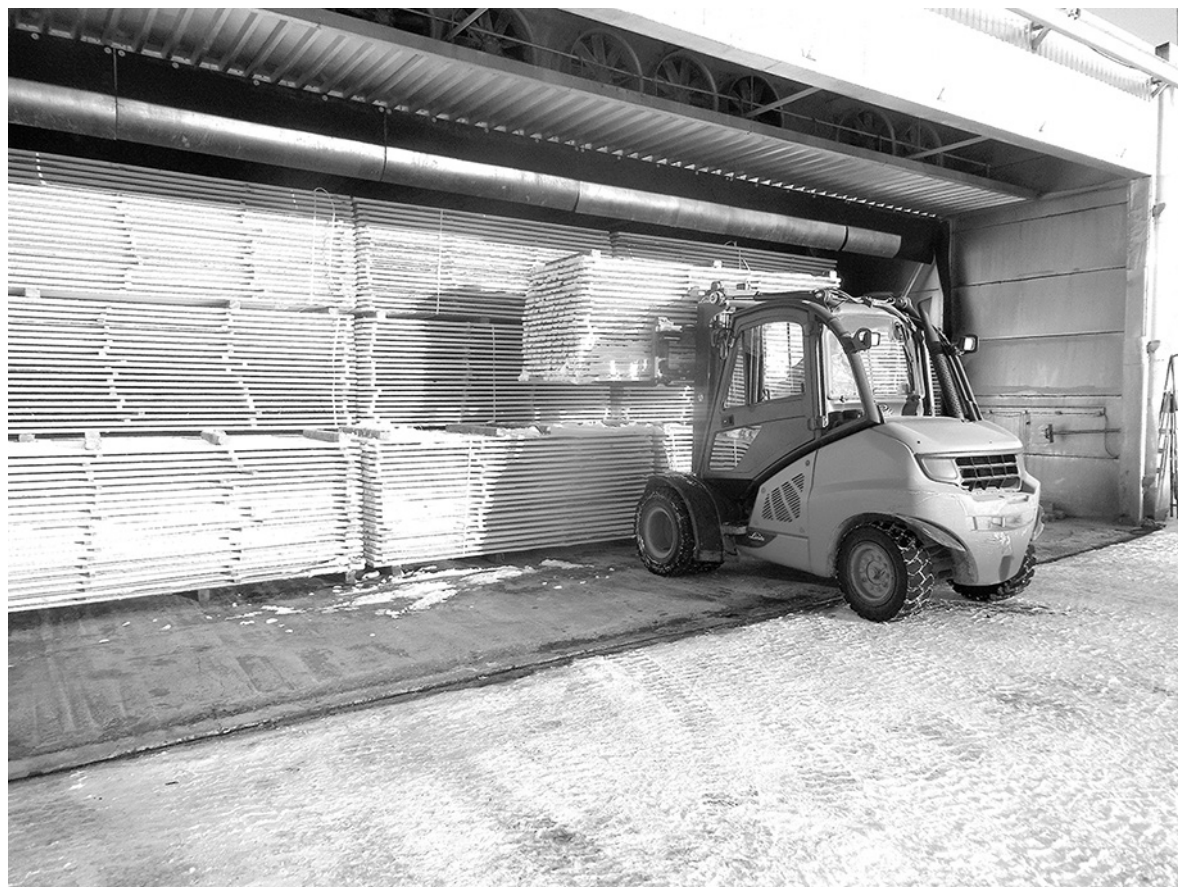
Загрузка пиломатериалов в сушильную камеру.

- Почти по четыре тысячи кубометров кругляка в месяц пилим. Запаса на весну пока почти нет. Долго ли зимняя дорога простоят? Обычно в последние дни сезона почти вся древесина на нижний везется, это сейчас на город лесовозы идут.