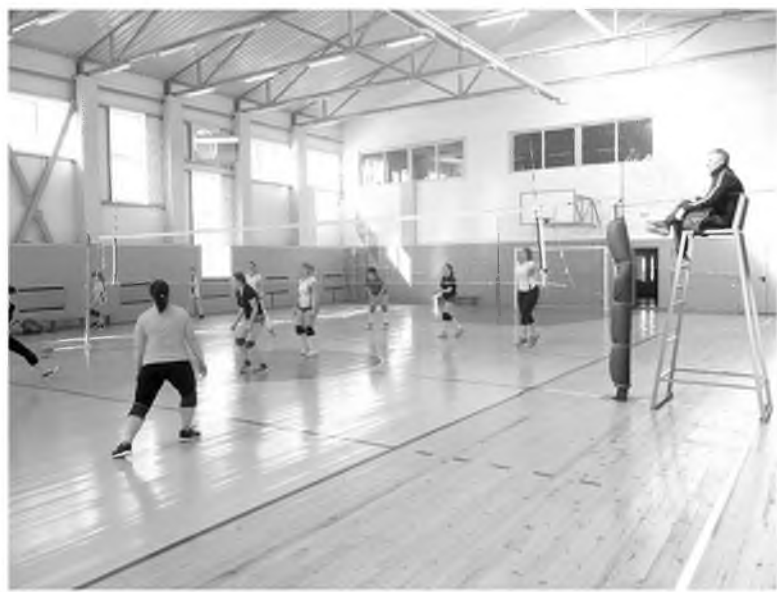
Волейбольный турнир.

Без обмана, пусть и невольного, все-таки не обошлось. Объявили начало в 11, а начали в 10. Весна ведь, у спортивных красавиц много других дел, нельзя весь день посвящать мячу и сетке, даже если игра очень привлекает.