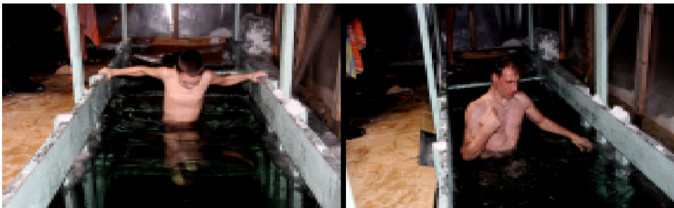
Этой русской удалой традиции - купаться в студёных водах на Крещение, придерживаются многие мамчане, приходится окунаться в проруби целыми семьями. Кто-то говорит, что после купания они ощущают легкость, блаженство и даже испытывают любовь ко всему миру, но главное, чтобы все они оставались здоровыми.

что с горы казалось, что вокруг иордани происходит какое-то особое священнодействие. Наибольший наплыв посетителей иордани и купели наблюдался с полуночи до двух. По словам инспектора ГИМС Сергея Устогова, дежурившего на этой крещенской «вахте» в течение суток, ночью около 40 людей прошли «испытания ледяной водой» - искупались в купели.