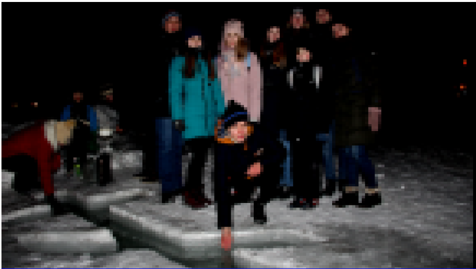
Наибольший наплыв посетителей иордани и купели наблюдался с полуночи до двух. На фото группа одиннадцатиклассников Мамской школы, они пришли с родителями набрать святой воды, которая считается целебной.