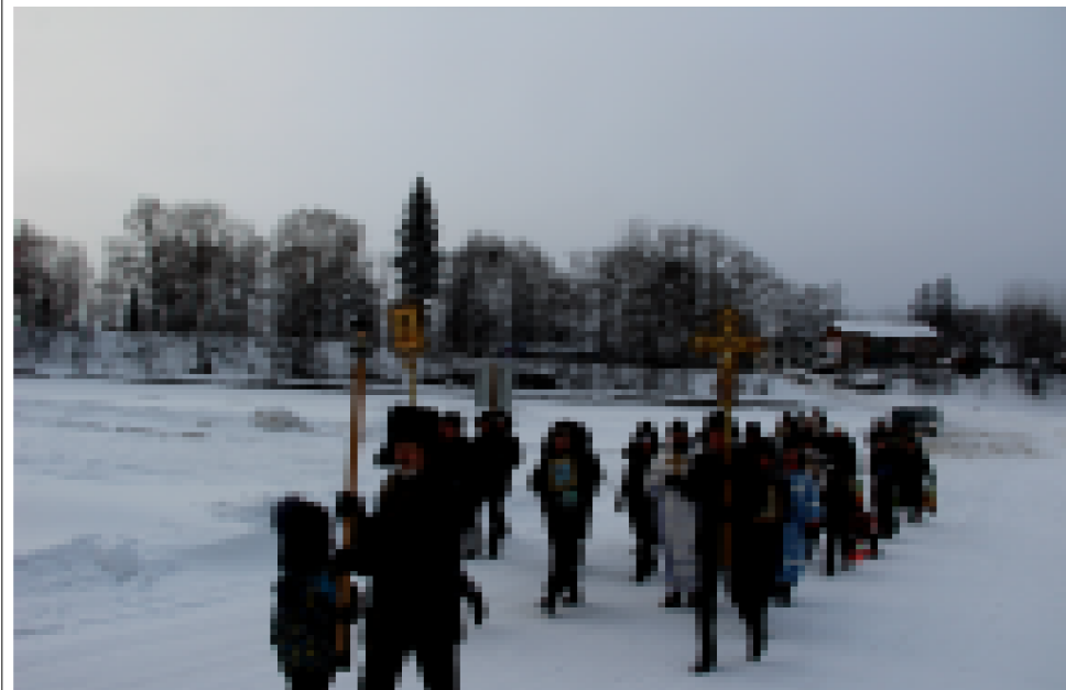
Утром следующего дня, 19 января, состоялся крестный ход от мамской церкви Покрова пресвятой Богородицы к иордани, прорубленной на Васьковском взвозе

... Ещё одним деянием наших властей, наглядно показавшим своё отношение как к своим гражданам, так и ко взятым страной обязательствам, явилось подписание Россией 24.04.1998г. и ратификация в апреле 2008 года «Соглашения о международных стандартах на гу-