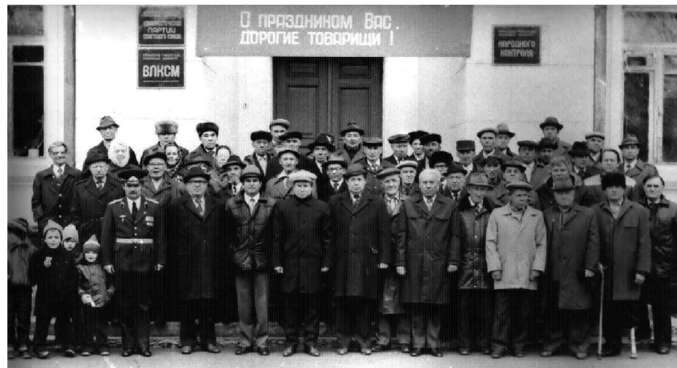
Ветераны Отечественной войны, партийные, советские хозяйственные работники Мамзено-Чуйского района 9/V-1986г.