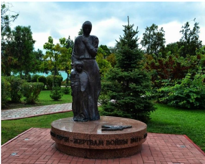
Памятник детям Керчи – жертвам Великой Отечественной войны, монумент размещен в парке Славы, который находится в самом центре Керчи