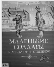
«Маленькие солдаты Великой Отечественной».

Повесть «Иван» рассказывает о 12-летнем разведчике, о его трагической судьбе. В повести «Зося» - о возвышенной и чистой любви советского лейтенанта к польской девушке.