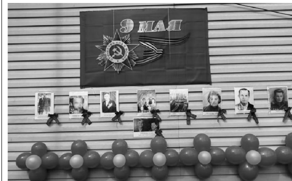
Здание коммунального предприятия ООО «Теплоресурс» трудовой коллектив оформил фотографиями своих родных, участников ВОВ и тружеников тыла