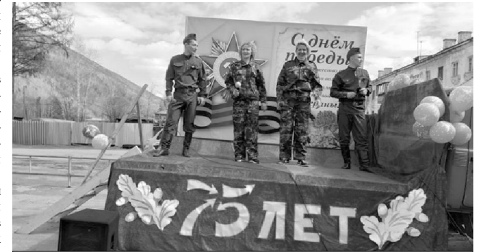
Целый день фронтовая бригада из работников РКДЦ «Победа» гастролеровала с концертной программой по улицам посёлка Мама