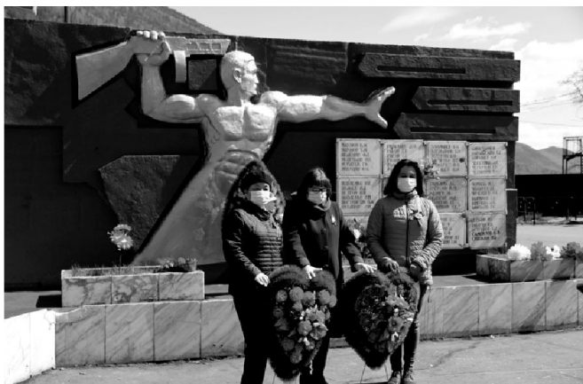
Соблюдая меры безопасности пришли возложить венки к подножию памятника работники социальной защиты населения

Эти творческие находки, по-другому не назовешь, также популяризовали посредством социальных сетей. Новые технологии давно и прочно вошли в нашу жизнь и благодаря креативным подходам преподавателей Детской музыкальной школы п. Мама, педагогам районного Дома детского творчества, воспитателям детских садов юные жители Мамско-Чуйского района не остались в стороне от праздника Победы. Дети читали стихи о Победе, пели песни о войне, рисовали рисунки по военной тематике, танцевали. В общем, это был масштабный творчес-