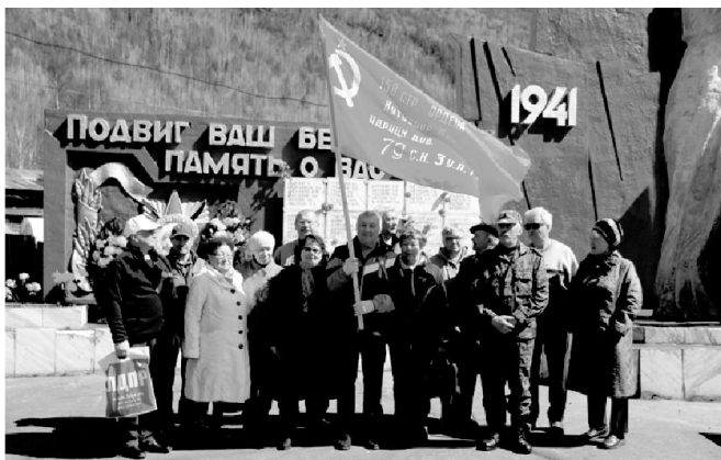
Под флагом местного отделения КПРФ к памятнику воинов-мамчан пришла группа жителей, но массовости не было, мамчане послушно остались дома

Образовательные учреждения района подготовили к празднику различные ролики и фотоколлажи на тему празднования Великой Победы с участием детей.