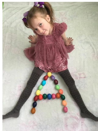
Евгения Карасова