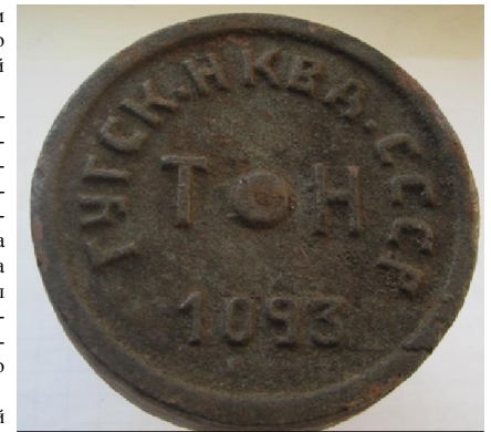
Чугунный знак с Манюкана

Геодезические работы в том районе велись в послевоенное время, а чугунные знаки еще довоенные.