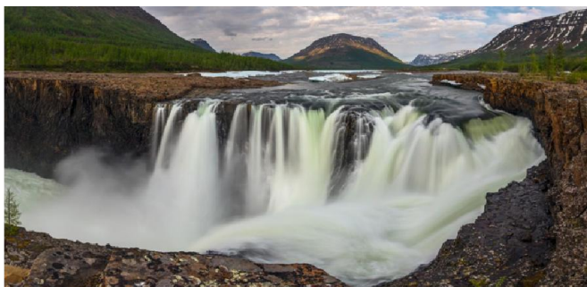
Водопад на Витиме

Для проведения работ по аэросъемке и обеспечения строительства геодезической сети создается цепь гидропунктов от Байкала до Дальнего Востока. Строятся жилые и складские помещения, по зимнику завозятся горюче-смазочные материалы, продовольствие, оборудова-