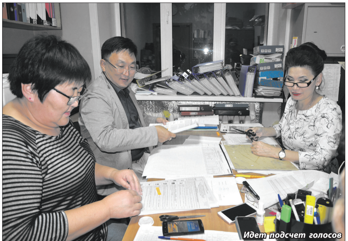
Идет подсчет голосов