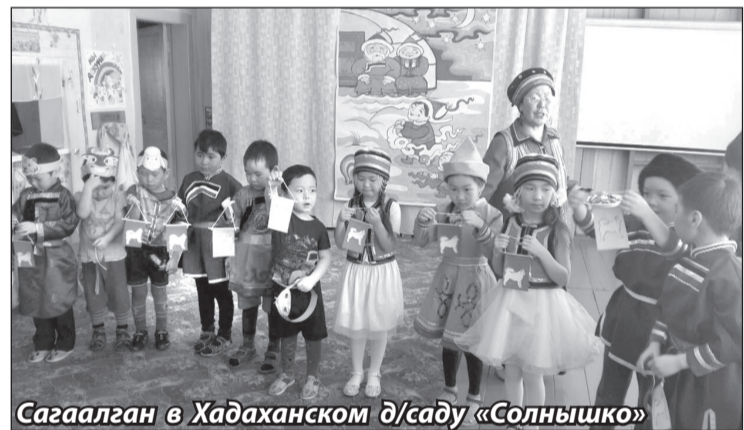
Сагаалган в Хадаханском д/саду «Солнышко»

– Вся работа по агробизнес-образованию должна проходить в тесном контакте с семьей, – считают педагоги-воспитатели детского сада. – Родители должны стать партнерами, активными участниками всех праздников в детском саду, участвовать в организации