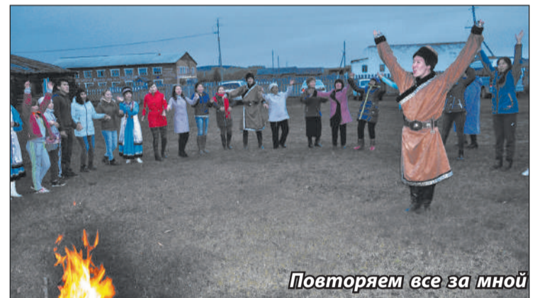
Повторяем все за мной