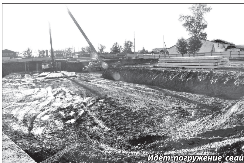
Идет погружение свай