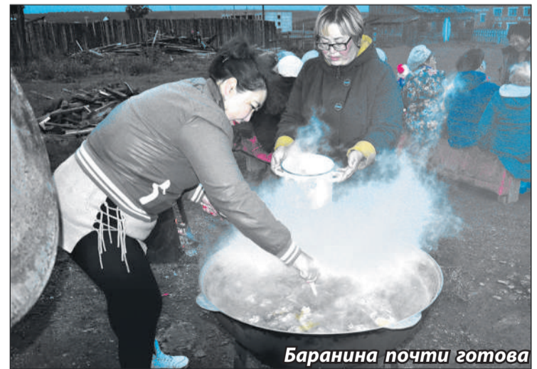
Баранина почти готова