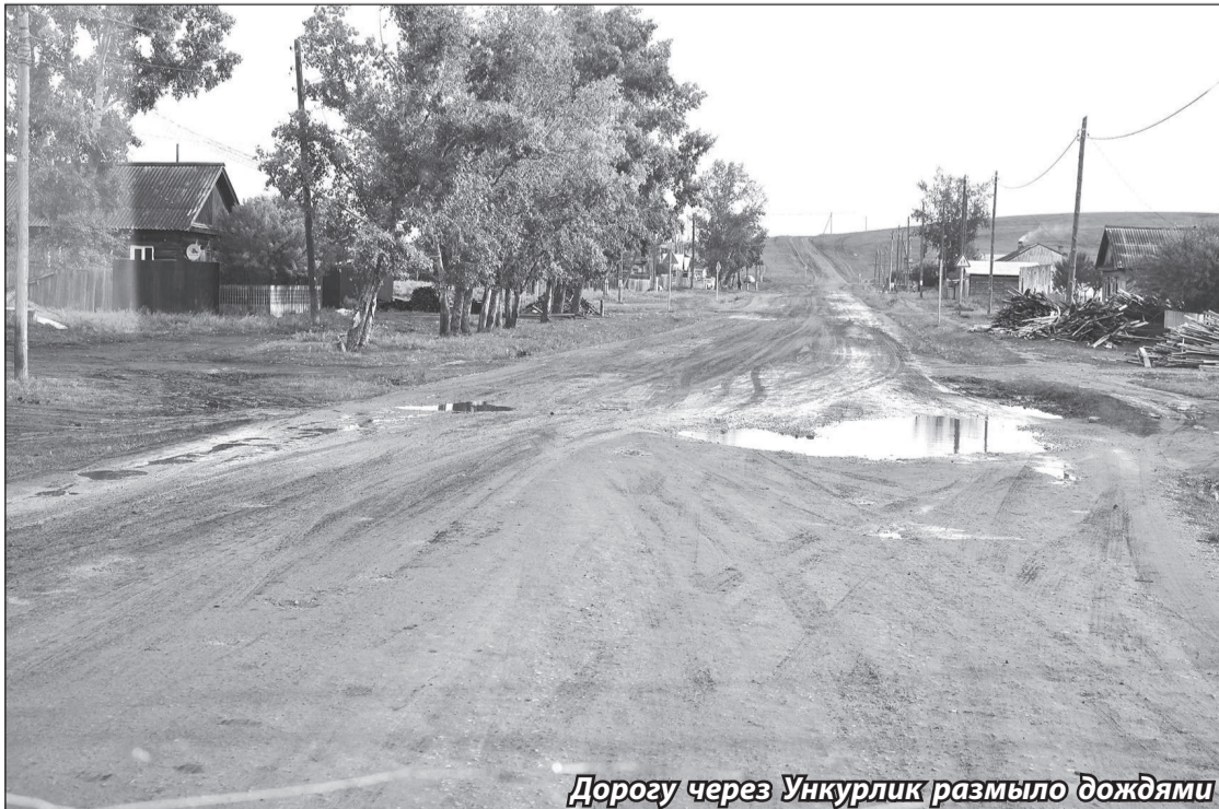
Дорогу через Ункурликк размывает дождем