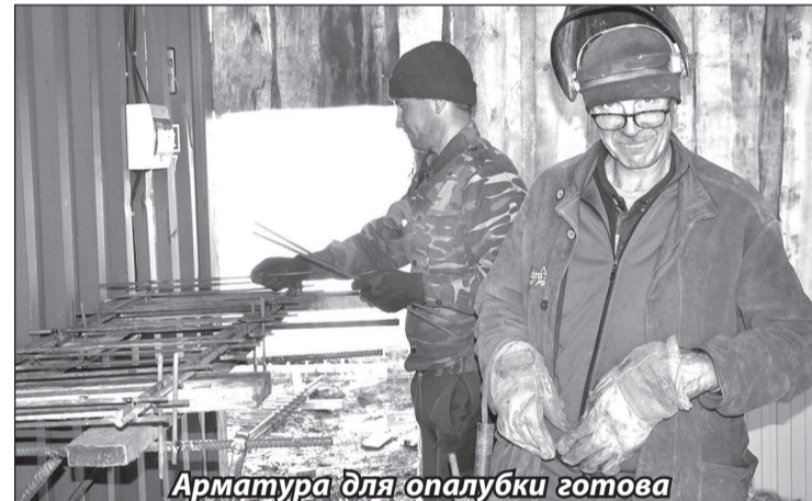
Арматура для опалубки готова

Привыкшие к своему «архитектурному памятнику» – зданию заброшенной недостроенной школы, жители Целинного интересуются – будут ли его сносить или оно и дальше будет