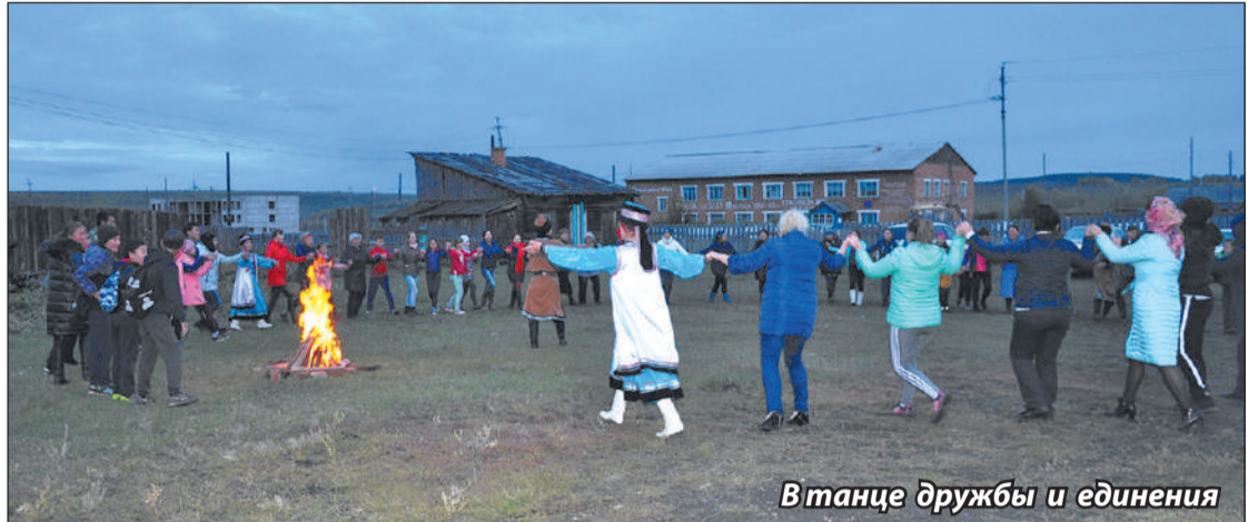
В танце дружбы и единения

Еще одна старинная бурятская забава под названием «Һээр шаалган» (разбивание хребтовой кости) становится все более популярной среди современной молодежи.