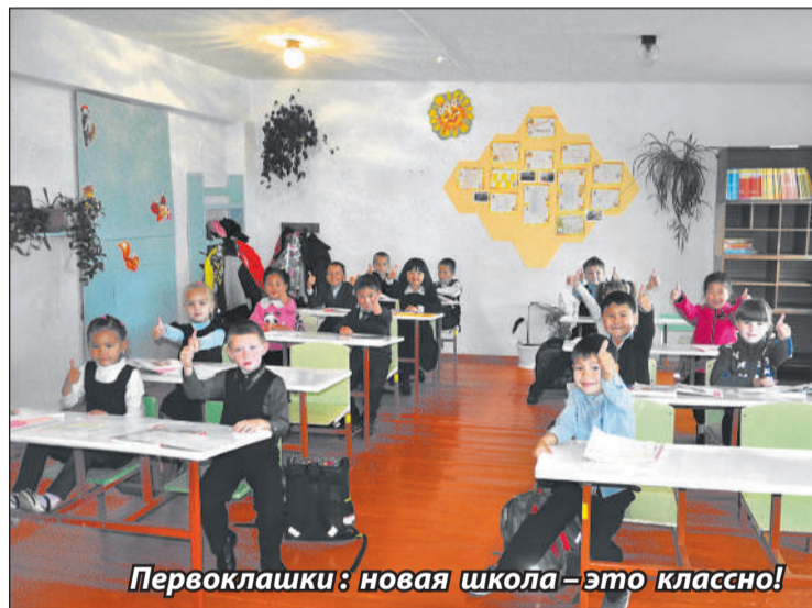
Первоклашки: новая школа – это классно!