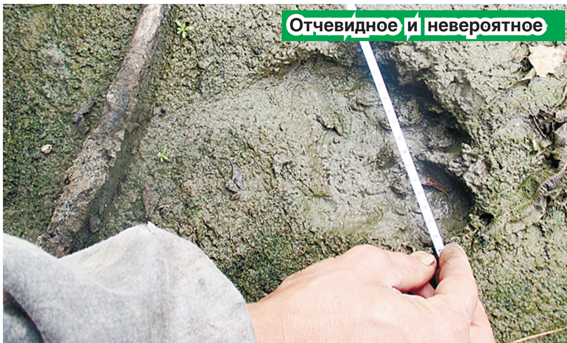
Отчевидное и невероятное