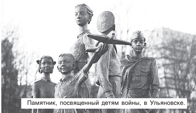
Памятник, посвященный детям войны, в Ульяновске.

Руководитель организации и члены ее совета обращаются к тем, кому дорога память и есть желание поделиться воспоминаниями о своих мамах, вдовах участников той жестокой войны. Эти женщины – героини, потому что, проводив мужей, отцов на фронт, они остались один на один с одиночеством и чаще всего с детьми на руках (как правило, семьи того времени были многодетными).