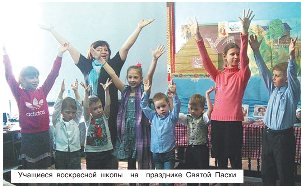
Учащиеся воскресной школы на празднике Святой Пасхи

Мало кто знает, что в Маслянино вот уже много лет ведёт свою богословскую работу Воскресная школа при храме. Преподавать в этой школе не так просто, нужно иметь определённые знания, наверное, поэтому много педагогов сменилось в школе за годы её существования. Были, к сожалению, и времена полного затишья в этих стенах. Но, слава Богу, с апреля этого года занятия возобновились, и к нам пришли первые ученики разных возрастов. Мы всем были очень рады! И хотя времени было совсем мало, мы успели выучить с ребятами песенки и стихи к самому Светлому празднику — Пасхе — и поставить кукольный мини-спектакль «Пасхальный теремок» (участники на фото).