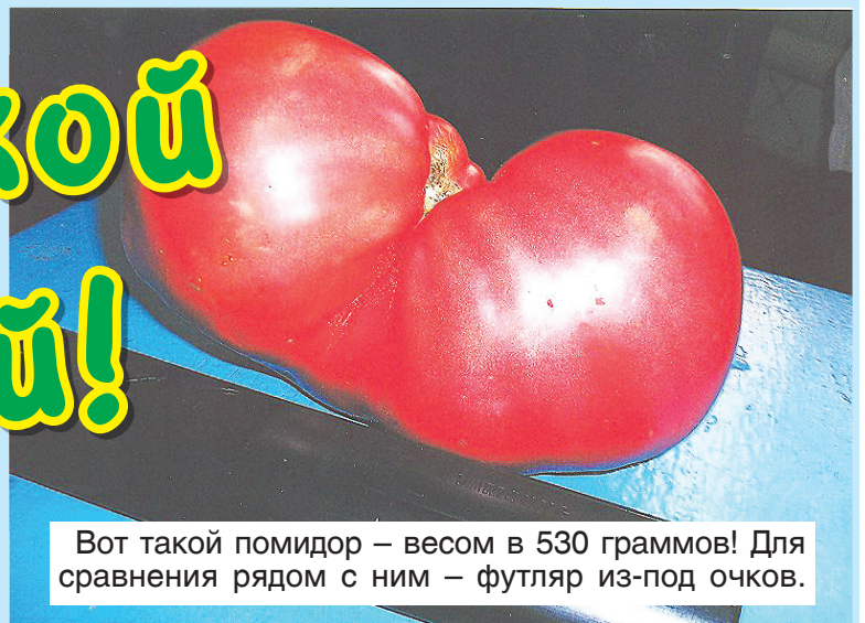
Вот такой помидор – весом в 530 граммов! Для сравнения рядом с ним – футляр из-под очков.