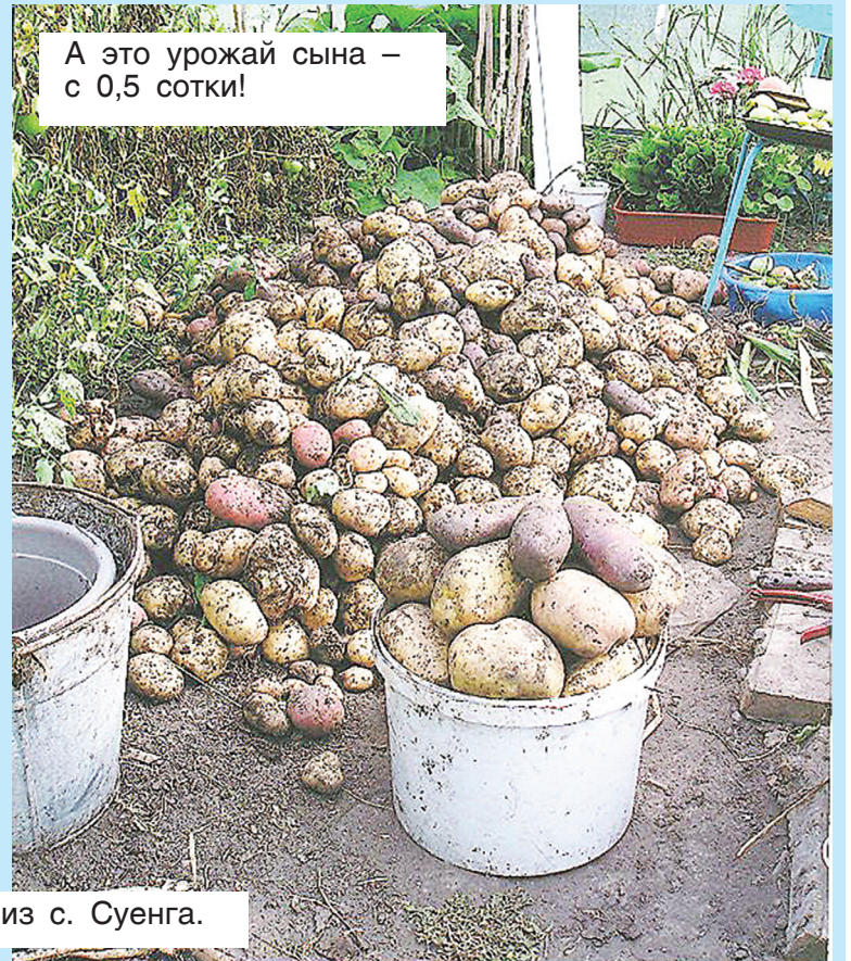
А это урожай сына – с 0,5 сотки!