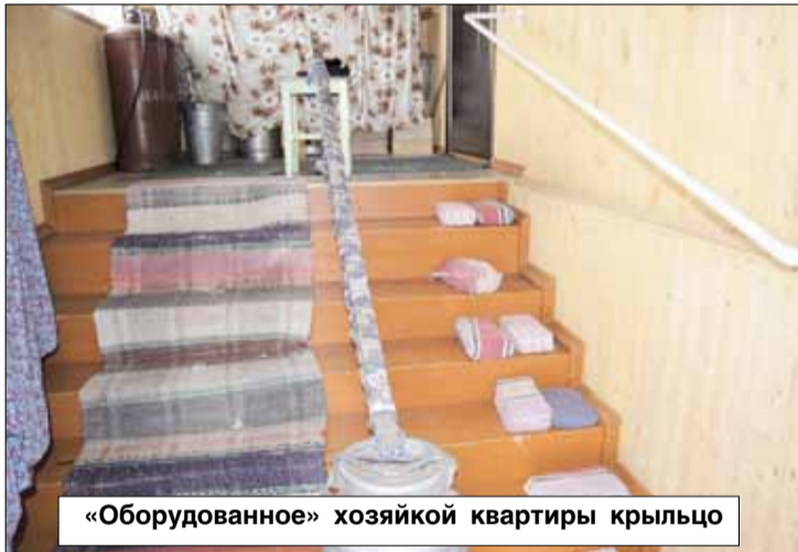
«Оборудованное» хозяйкой квартиры крыльцо