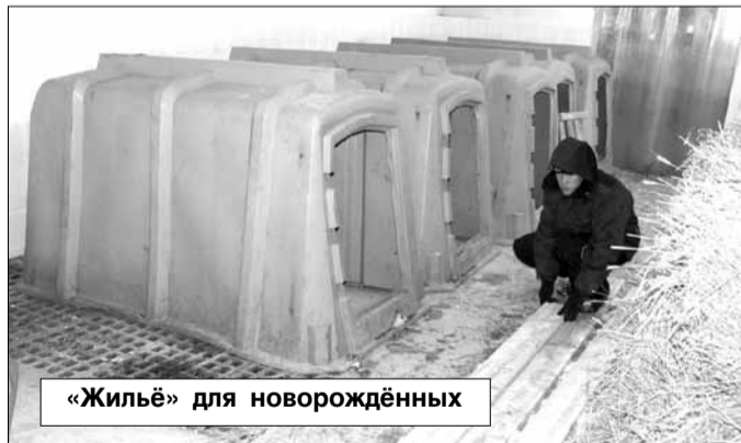
«Жильё» для новорождённых