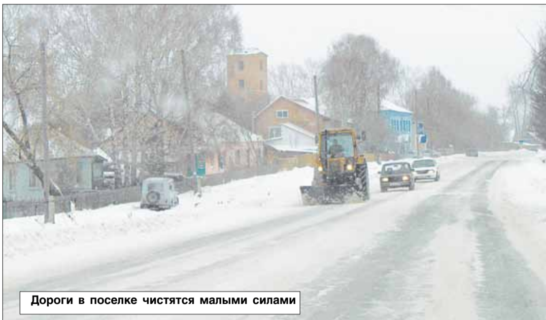
Дороги в поселке чистятся малыми силами

Первая часть заголовка основана на информации, полученной во время заседания комиссии по предотвращению ЧС, состоявшегося в минувший вторник. Вторая – на фактах, убедиться в наличии которых мог каждый сибиряк. За двое с небольшим суток на нас выпала почти месячная норма осадков, снег толстым слоем укрыл неровности дорог и ... ограничил по ним движение.