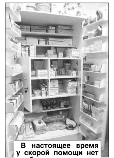
В настоящее время у скорой помощи нет проблем с медикаментами