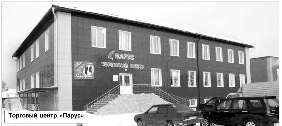
Торговый центр «Парус»