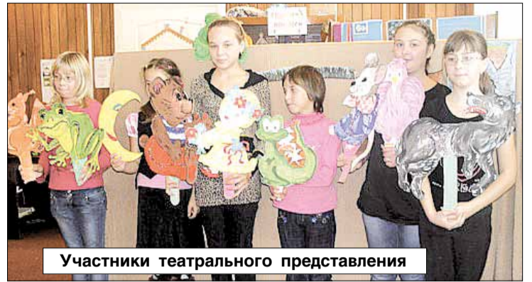
Участники театрального представления