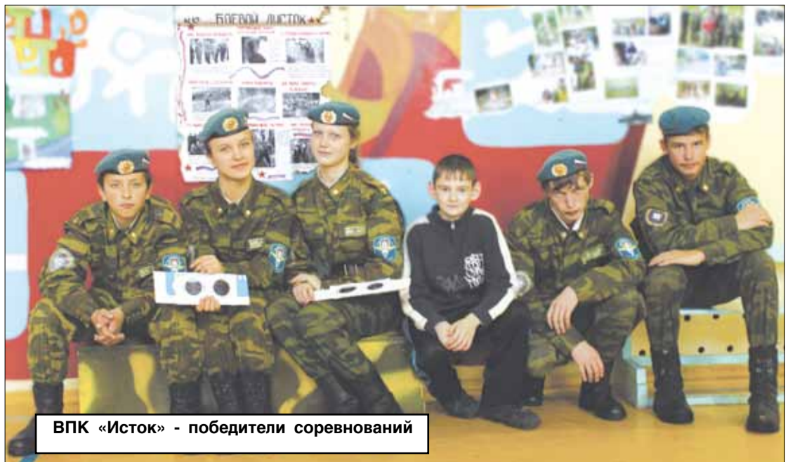
ВПК «Исток» - победители соревнований

Телефон для справок: 21-873 (отдел молодежи), 22-648 (КДН).