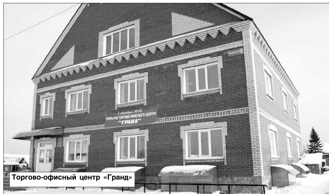
Торгово-офисный центр «Гранд»

тральных улиц райцентра — на Садовой. 1 ноября открылись двери торгово-офисного центра «Гранд». Он действительно «большой» и, надо отметить, уютный. Правда, пока заполнен арендаторами меньше, чем наполовину. Для себя ваш корреспондент отметил появление в здании ещё одного хозяйственного магазина, он называется «Уют». Площадь центра, скорее всего, около 300 квадратных метров, более точную цифру узнать не удалось.