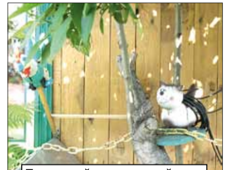
Тот самый «кот ученый», что «ходит по цепи кругом»