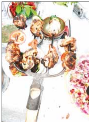
Туристическое блюдо для жюри