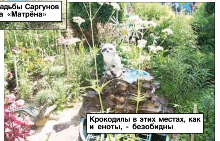
Крокодилы в этих местах, как и еноты, - безобидны