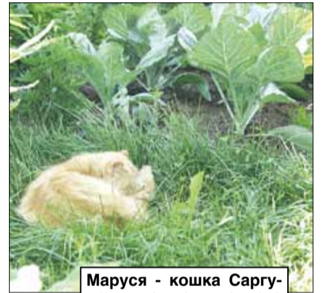
Маруся - кошка Саргунов - нашла в капусте «гнездышко»