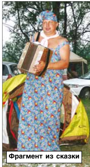
Фрагмент из сказки