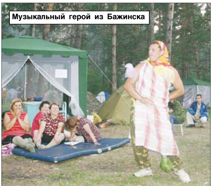
Музыкальный герой из Бажинска