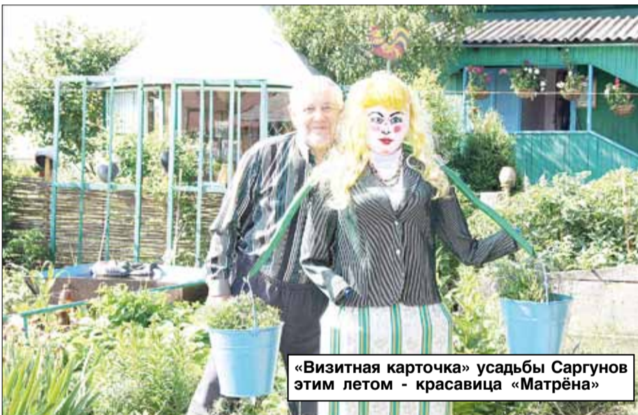
«Визитная карточка» усадьбы Саргунов этим летом - красавица «Матрёна»