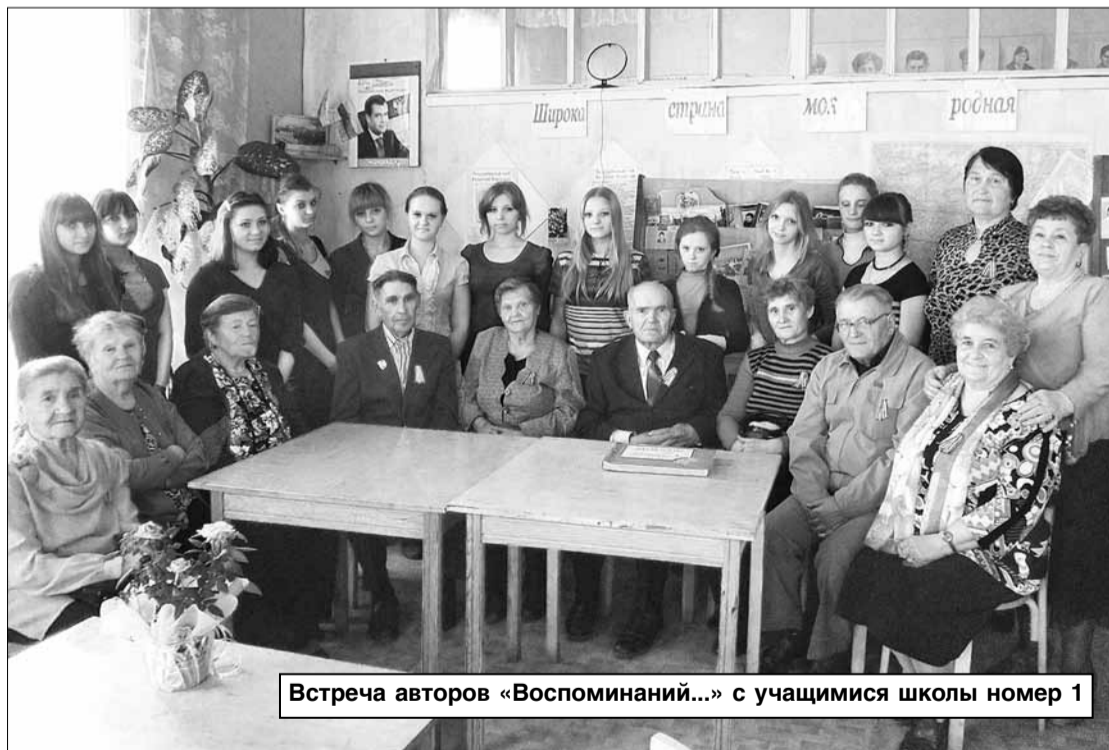
Встреча авторов «Воспоминаний...» с учащимися школы номер 1