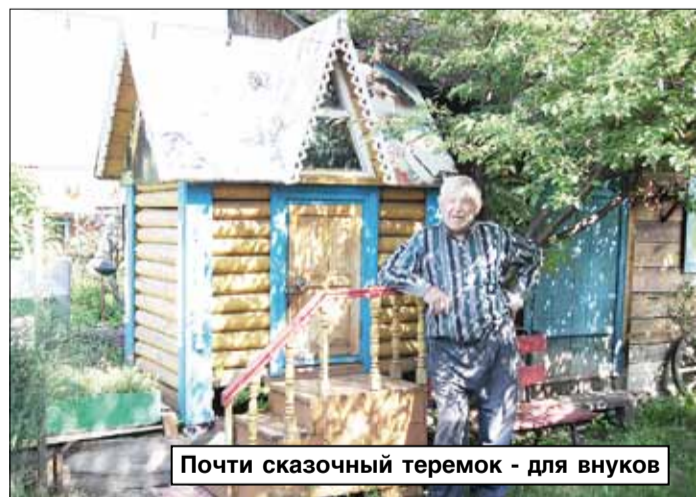
Почти сказочный теремок - для внуков