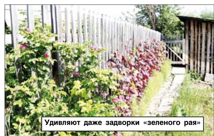
Удивляют даже задворки «зеленого рая»