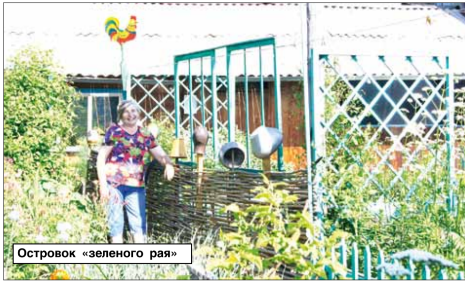
Островок «зеленого рая»

Впрочем, не буду зря занимать газетную страницу словами. Лучше отдам ее под фотокартинки подворья. И вы всё увидите сами. Отмечу только, что каждую весну в «зеленом раю» Саргунов обязательно появляется что-то новое - детали «декорацй» постоянно меняются, как сама жизнь. Вот и в этом весенне-летнем сезоне на подворье Саргунов - два новых действующих «лица»: красавица «Матрёна» и сторож «Будулай». Оба исправно несут здесь свою службу: «Матрёна» радушной улыбкой встречает и провожает гостей, «Будулай» охраняет ягодные посадки от бессовестных сорок.