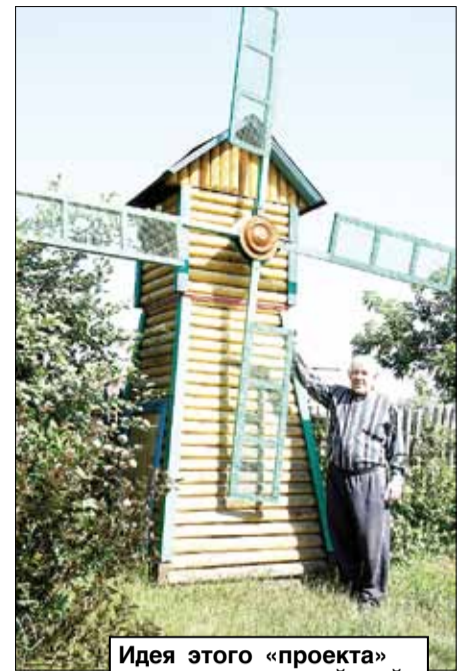
Идея этого «проекта» привезена с алтайской выставки