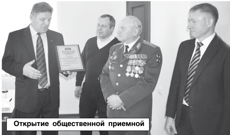
Открытие общественной приемной

Более четырех месяцев шла работа по подготовке офиса. 28 октября общественная приемная была открыта в селе Егорьевском. И в настоящее время уже проводится прием жителей района, обработка по-