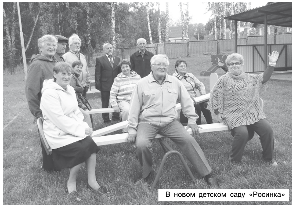
В новом детском саду «Росинка»