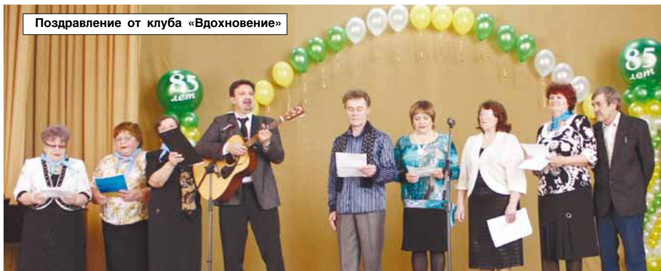
Поздравление от клуба «Вдохновение»