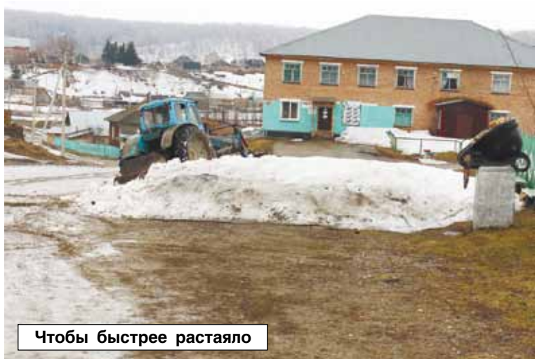
Чтобы быстрее растаяло