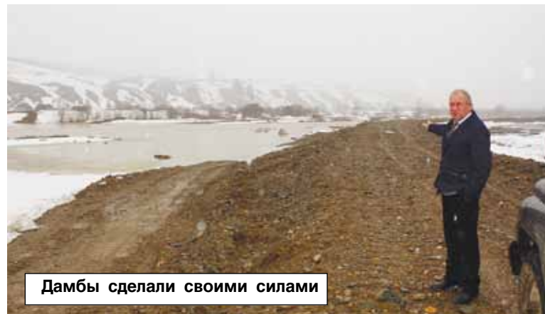
Дамбы сделали своими силами