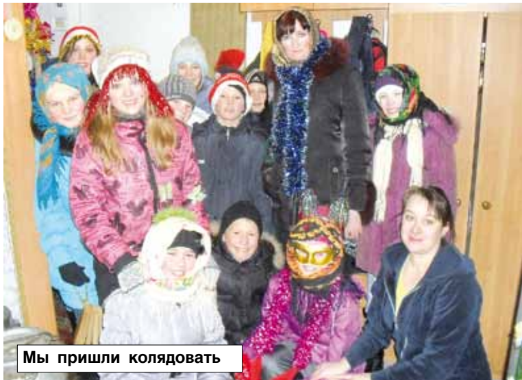
Мы пришли колядовать