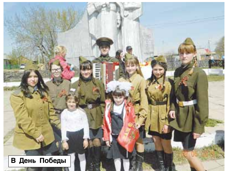
В День Победы