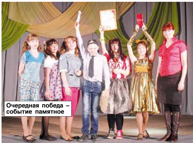
Очередная победа – событие памятное

пятого класса их классным руководителем, ребята изучают обычаи и традиции русского народа. С ними связаны многие театральные постановки и темы проектов учащихся. «Петрушками» проведены «Рождественские встречи», «Калядки», «Крещенские вечера», «Масленица», «Иван-Купала», «Яблочный спас», и другие мероприятия. Все труднее становится выбрать время для репетиций. Девочки из кружка занимаются в ДШИ на музыкальном или художественном отделениях, мальчики – спортом. А в этом году девятый класс еще готовится и к экзаменам. Поэтому репетировать приходится даже на переменах. Но для творческих личностей трудности не страшны, для них важен резуль-