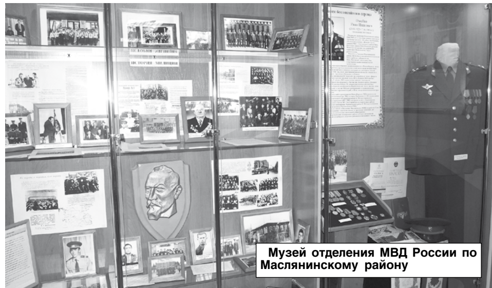
Музей отделения МВД России по Маслянинскому району

- Финансирование и модернизация материально-технического обеспечения полиции достойные. Следует отметить, что в этом году отделение получило три новых автомобиля, два из