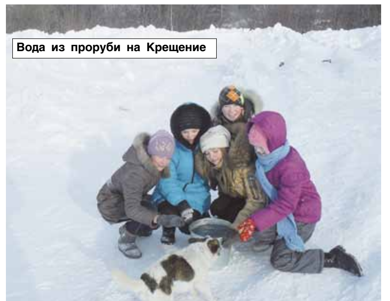
Вода из проруби на Крещение

пятого класса их классным руководителем, ребята изучают обычаи и традиции русского народа. С ними связаны многие театральные постановки и темы проектов учащихся. «Петрушками» проведены «Рождественские встречи», «Калядки», «Крещенские вечера», «Масленица», «Иван-Купала», «Яблочный спас», и другие мероприятия. Все труднее становится выбрать время для репетиций. Девочки из кружка занимаются в ДШИ на музыкальном или художественном отделениях, мальчики – спортом. А в этом году девятый класс еще готовится и к экзаменам. Поэтому репетировать приходится даже на переменах. Но для творческих личностей трудности не страшны, для них важен резуль-