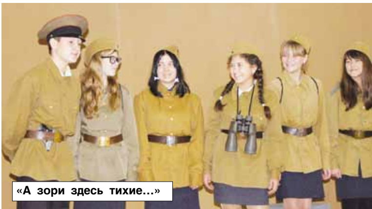
«А зори здесь тихие...»

- На первом серьезном выступлении в Маслянино, ожидая выхода на сцену, ребятки так разбаловались и расшумелись, что ни я, ни организаторы конкурса никак не могли их успокоить. Участвовало их тогда 20 человек, и, наверное, столько же замечаний по поводу их поведения мне пришлось выслушать. Сейчас вряд ли кто-то из членов жюри догадается, что перед ними те самые шумные непоседы. Еще на одном выступлении одна из девочек упала, но, не-