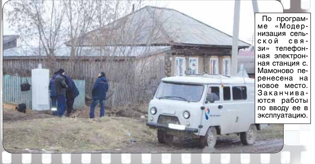
По программе «Модернизация сельской связи» телефонная электронная станция с. Мамоново перенесена на новое место. Заканчиваются работы по вводу ее в эксплуатацию.