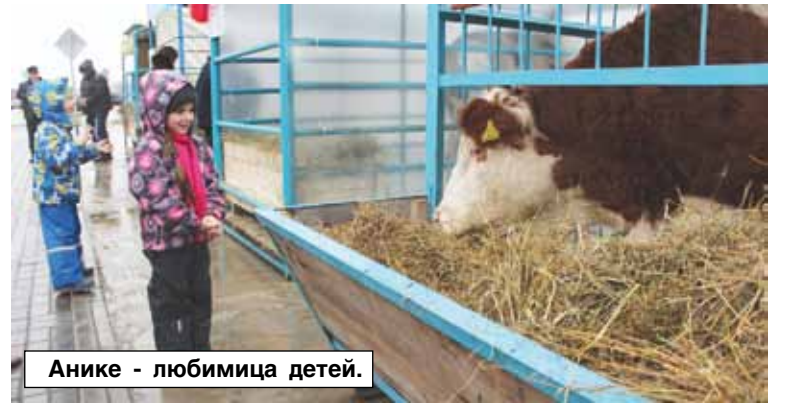
Анике - любимица детей.