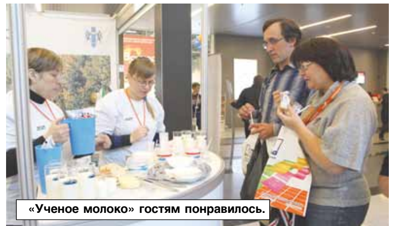
«Ученое молоко» гостям понравилось.