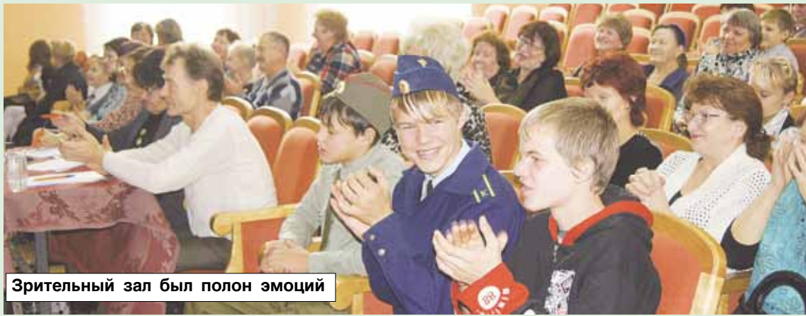
Зрительный зал был полон эмоций