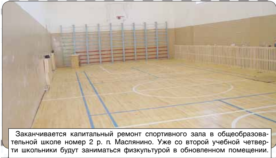
Заканчивается капитальный ремонт спортивного зала в общеобразовательной школе номер 2 р. п. Маслянино. Уже со второй учебной четверти школьники будут заниматься физкультурой в обновленном помещении.