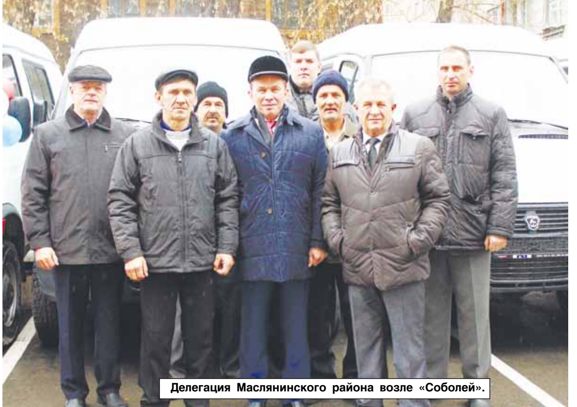
Делегация Маслянинского района возле «Соболей».