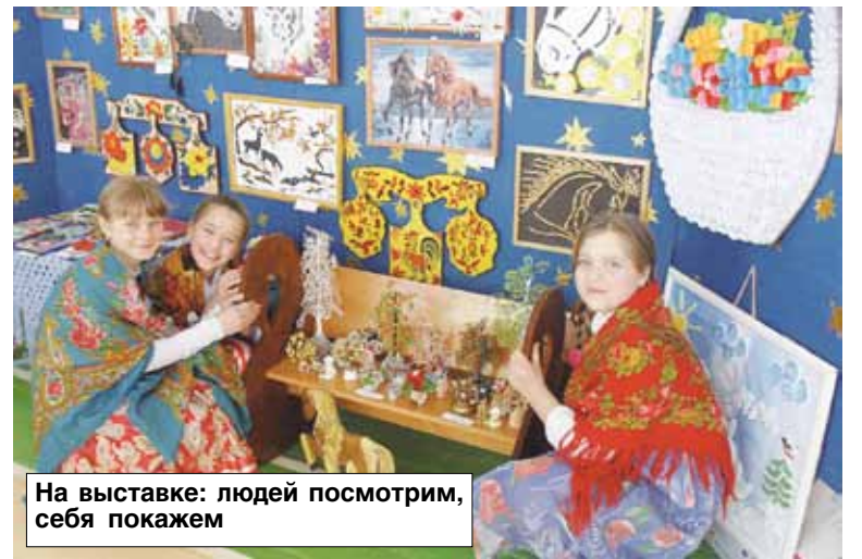
На выставке: людей посмотрим, себя покажем