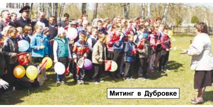
Митинг в Дубровке

Третий год накануне 9 мая в районе проходит замечательное мероприятие – автопробег «Великой Победе посвящается». 5 мая несколько автомобилей стартовали с центральной площади райцентра в направлении Суенги, Егорьевска и Дубровки.