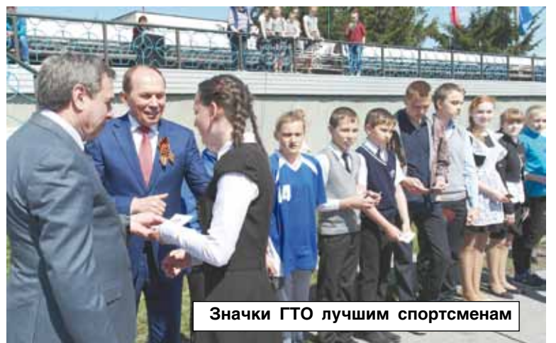
Значки ГТО лучшим спортсменам