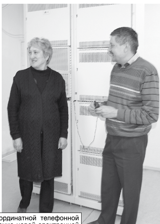
Пустует помещение координатной телефонной станции. А все оборудование новой электронной станции узла связи разместились в двух небольших комнатах, в нескольких шкафах.