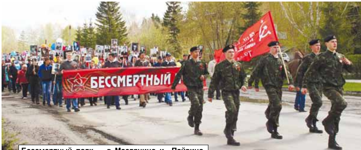
Бессмертный полк - в Маслянино и Пайвино