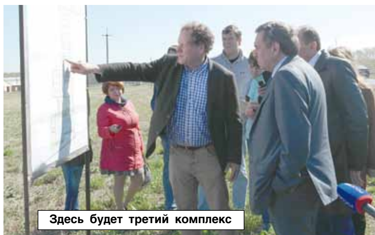
Здесь будет третий комплекс

Виктория ГРИГОРЬЕВА