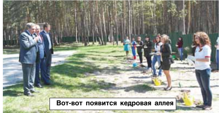
Вот-вот появится кедровая аллея