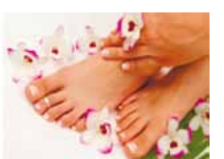
Уход за руками, ногами