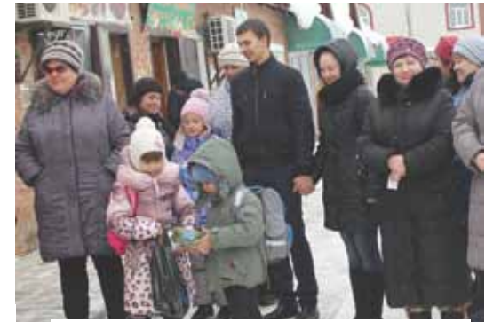
Как и всегда, желающих испытать удачу было много.