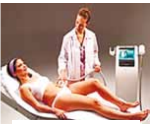
Аппаратная коррекция фигуры

На помощь здесь могут прийти различные методики правильного питания, занятия спортом и косметология. Вот о последнем направлении мы сегодня и поговорим, хотя речь пойдет вовсе не о пластических операциях и накачивании «ботоксом», а о воздействии на тело физиотерапевтических методик, которые называются АППАРАТНАЯ КОРРЕКЦИЯ ФИГУРЫ. И уже сегодня эти процедуры можно пройти не только в областном центре, но и у нас, в Маслянино. Давайте попробуем разобраться, на чем основана эта методика.