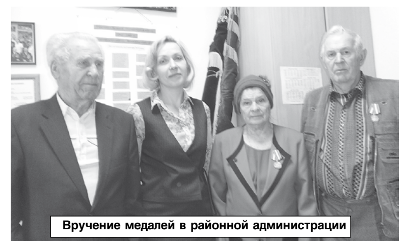
Вручение медалей в районной администрации