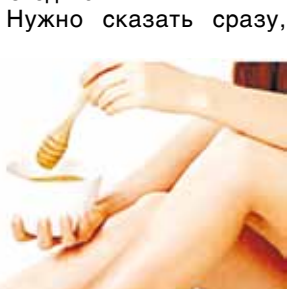
Депиляция (воск, шугаринг)

На помощь здесь могут прийти различные методики правильного питания, занятия спортом и косметология. Вот о последнем направлении мы сегодня и поговорим, хотя речь пойдет вовсе не о пластических операциях и накачивании «ботоксом», а о воздействии на тело физиотерапевтических методик, которые называются АППАРАТНАЯ КОРРЕКЦИЯ ФИГУРЫ. И уже сегодня эти процедуры можно пройти не только в областном центре, но и у нас, в Маслянино. Давайте попробуем разобраться, на чем основана эта методика.