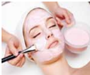
Уходовые программы по лицу

Чтобы укрепить мышцы и придать подтянутый вид фигуре, в аппаратной косметологии используют миостимуляцию. В ее основе влияние на мышцы тела переменного импульсного тока, которое вызывает ответ-