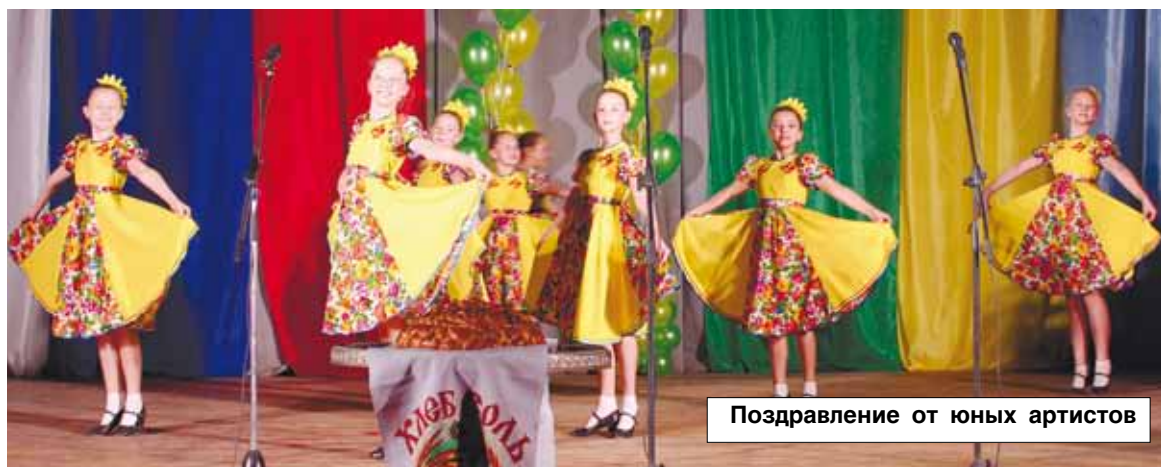
Поздравление от юных артистов