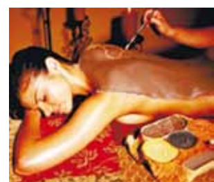
Все виды массажа

Знаю точно, что многие женщины посещают косметические салоны в го-