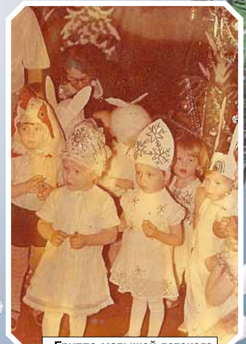
Группа малышей детского сада «Аленушка», 1981 год