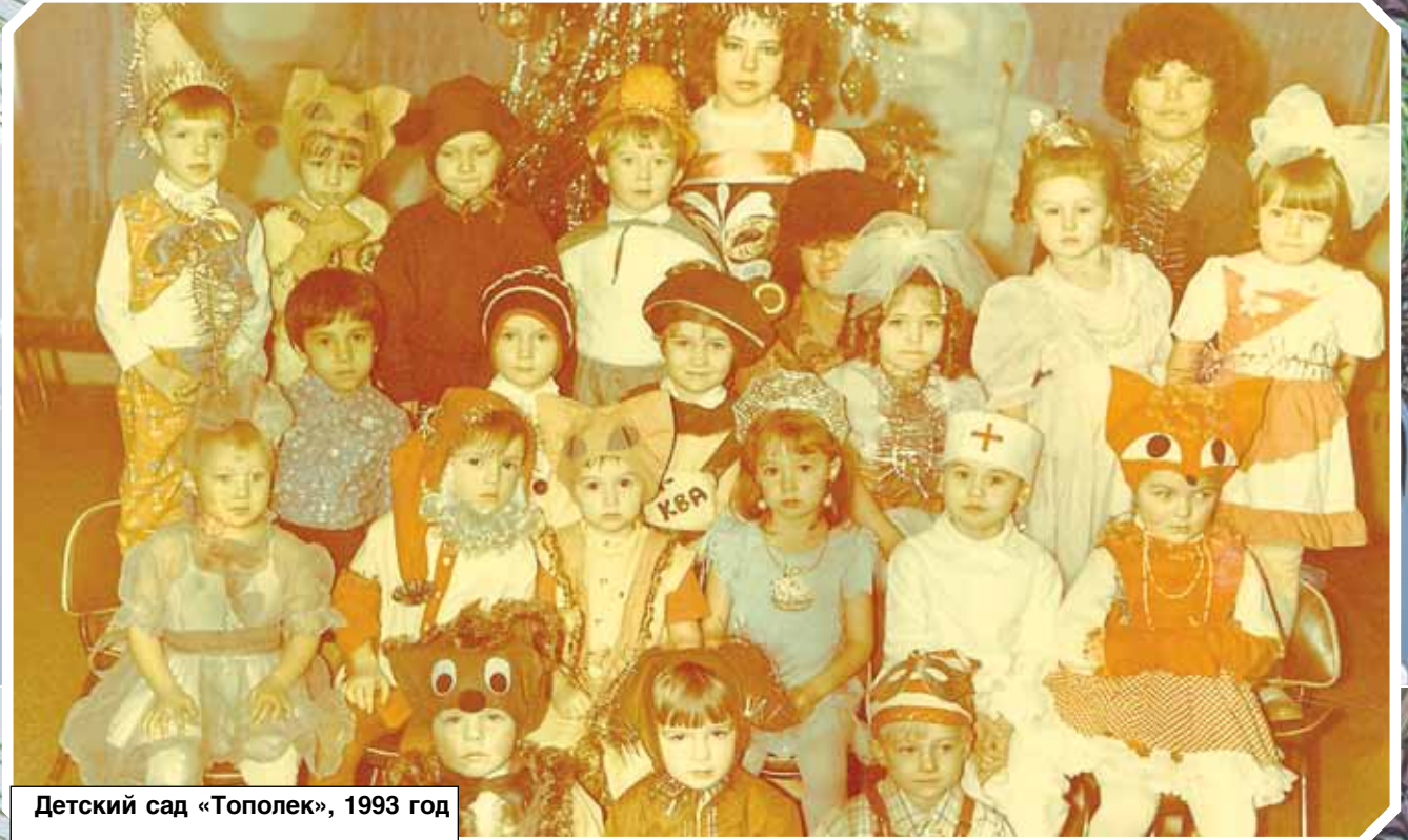
Детский сад «Тополек», 1993 год