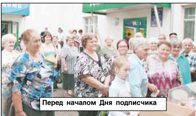
Перед началом Дня подписчика