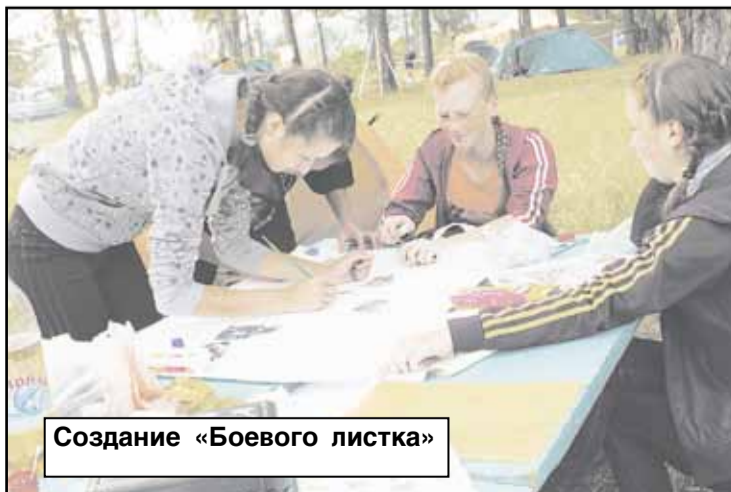
Создание «Боевого листка»

Виктория ГРИГОРЬЕВА