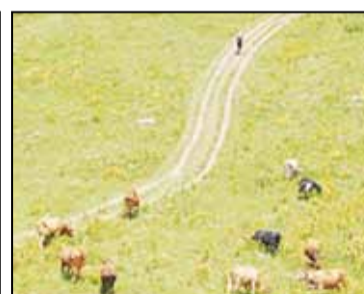
СВОДКА НАДОВ НА ФУРАЖНУЮ КОРОВУ НА 20 ИЮНЯ