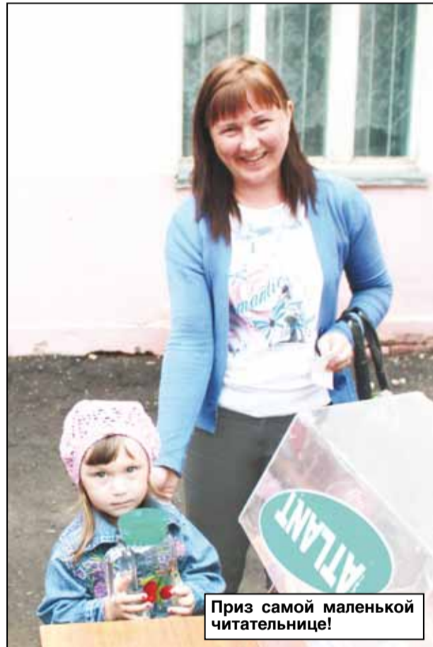
Приз самой маленькой читательнице!

15 июня у здания районного Узла связи было многолюдно. Более 80 человек пришли оформить подписку на районную газету и принять участие в беспроигрышной лотерее, где можно было выиграть вполне приятные призы: вазы, кофе, полотенца, чайники и многое другое. Отлично видеть людей, которые участвуют в празднике регулярно, и столь же приятно, когда у нас появляются новые читатели, подписавшиеся на районку впервые.