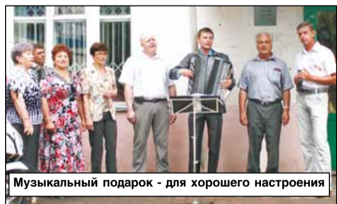
Музыкальный подарок - для хорошего настроения