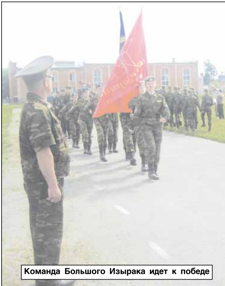
Команда Большого Изырака идет к победе

павшие на третий день, легкими никак не назовешь. Ребята соревновались в меткости стрельбы из пневматической винтовки, рисовали и писали «боевые листки», преодолевали полосу препятствий, которая неподготовленному человеку вряд ли покорилась бы с первого раза. Во второй половине дня конкурсы закончились, настало время ожидания подведения итогов.