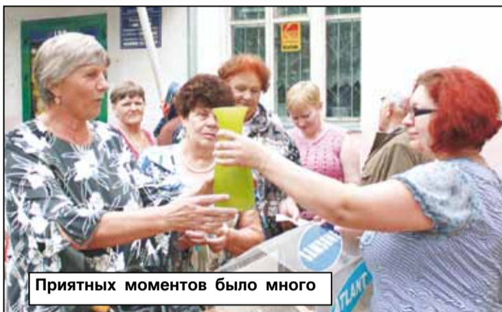
Приятных моментов было много

Более 80 лет назад вышел первый номер районной газеты «Маслянинский льновод», на страницах которой всегда отражалась и отражается вся многогранная жизнь Маслянинского района. Среди новостей минувшей недели – День подписчика, ставший традиционным и даже любимым праздником для многих читателей. Именно праздником, потому что артисты народных коллективов Маслянинского Дома культуры дарят всем участникам мероприятия в этот день свои песни и заряд хорошего настроения.