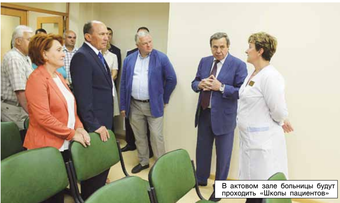
В актовом зале больницы будут проходить «Школы пациентов»

Виктория ГРИГОРЬЕВА