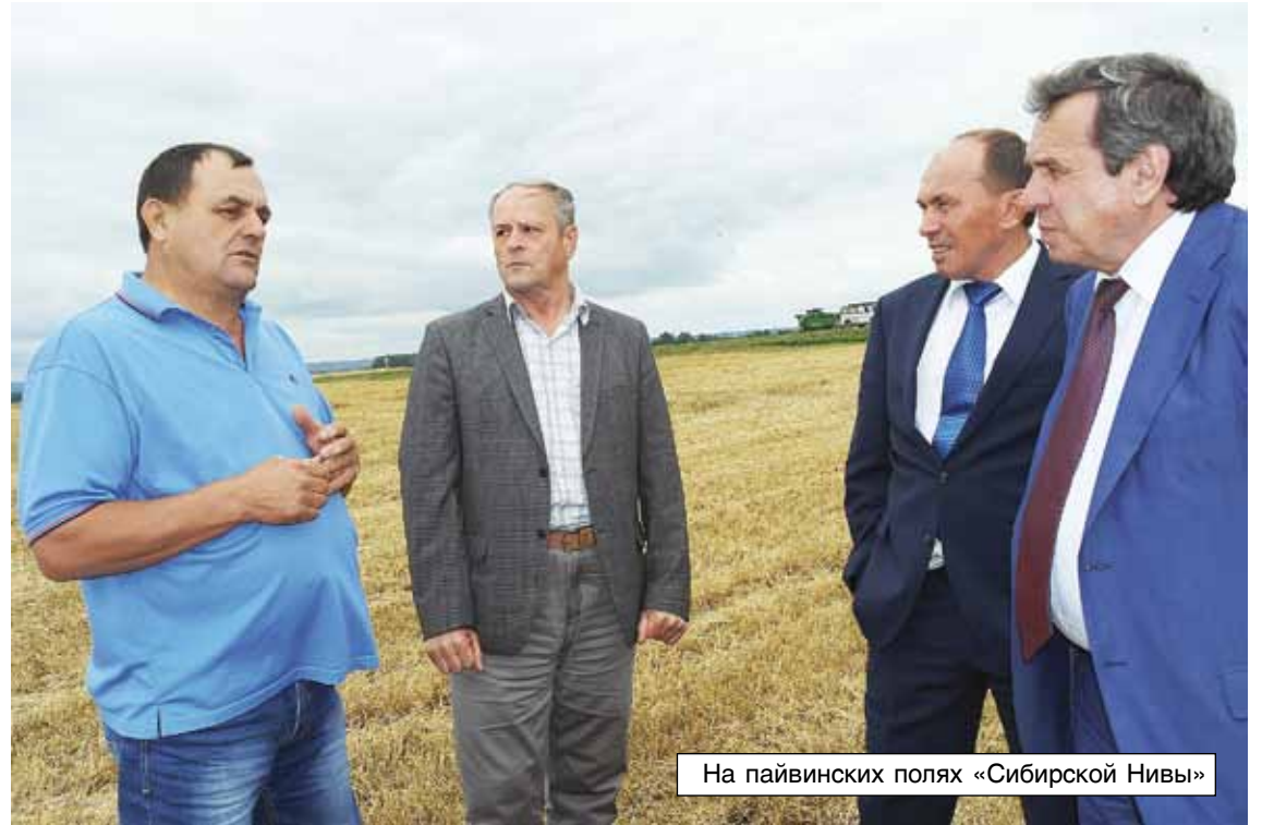
На пайвинских полях «Сибирской Нивы»

На прошлой неделе полеводы «Сибирской Нивы» завершили уборку озимой пшеницы. О ходе кормозаготовки и уборочной кампании, оказавшихся смежными по срокам в этом