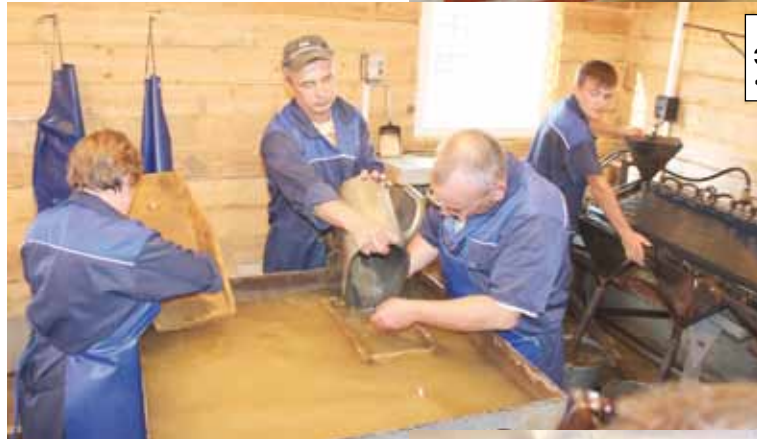
Вот так добывается золото. Экскурсия на предприятие ООО «Салаир»