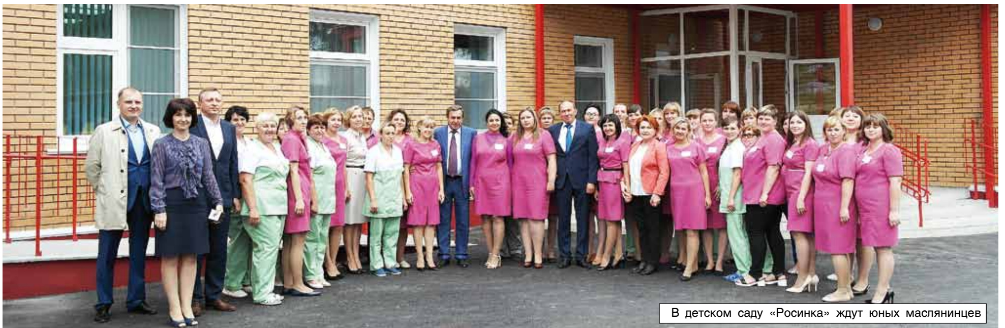
В детском саду «Росинка» ждут юных масляницев