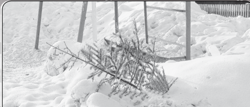
Еще совсем недавно зеленые красавицы елочки были востребованы и стоили не одну сотню рублей. Сейчас валяются у обочин дорог, у мусорных баков и просто за оградками не нужные... Эх, елочная жизнь!