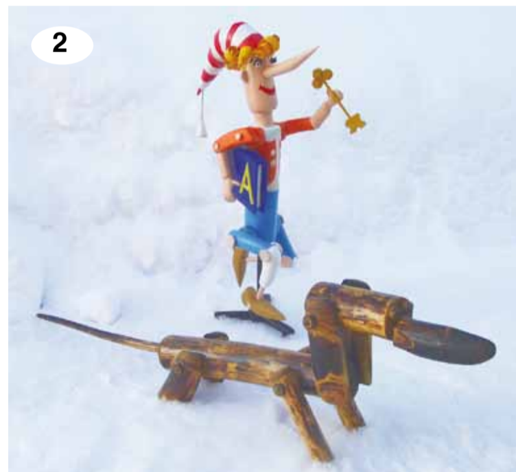
Работы Юрия Гнейдинг