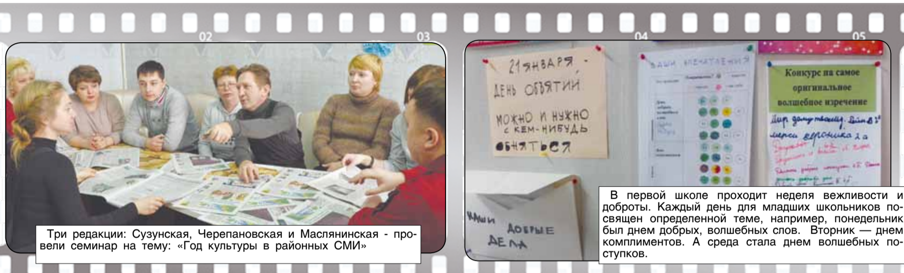
Три редакции: Сузунская, Черепановская и Маслянинская - провели семинар на тему: «Год культуры в районных СМИ»