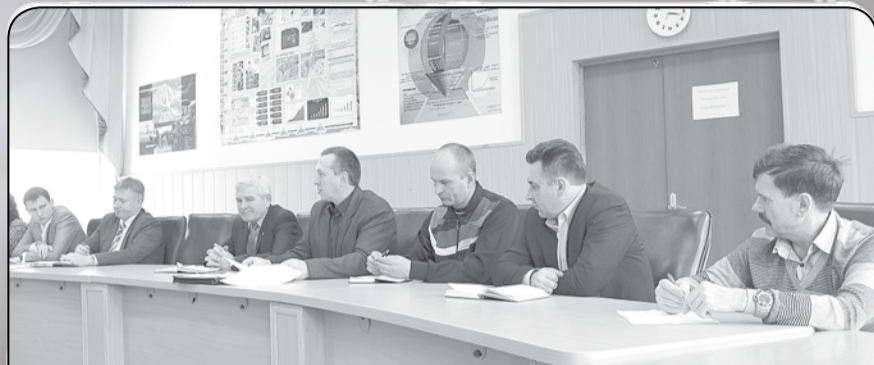
В понедельник состоялось первое заседание оргкомитета, посвященное финалу зимней спартакиады муниципальных образований, который пройдет в нашем районе с 28 февраля по 1 марта.