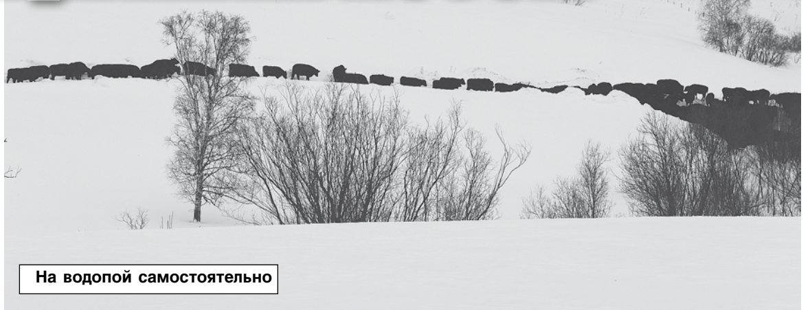
На водопой самостоятельно

Водопой для ангусов организован в естественном источнике, пьют водицу они из речек Изырак и Каменка (притоков Берди). Естественный водоем очищается операторами, которые отвечают за содержание. Операторы несколько раз в день делают обход, если нужно, то очищают от льда источ-