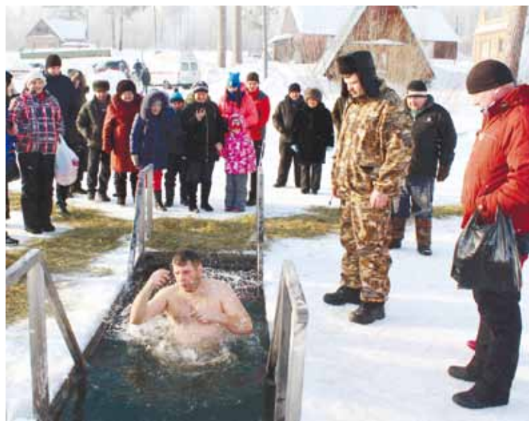
С уважением жители поселка Воробьева Заимка