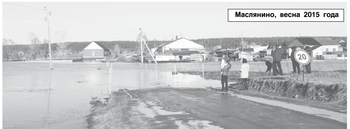
Маслянино, весна 2015 года