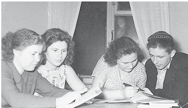
Подготовка к немецкому языку: зима, вечер... 1960 год. «Науки девушек питают – отраду юношам дают!»

Мне довелось учиться в советское время, в эпоху «шестидесятников», когда учеба была бесплатной, и общежитие тоже. Многие поступали уже с опытом работы, я же – после окончания школы.