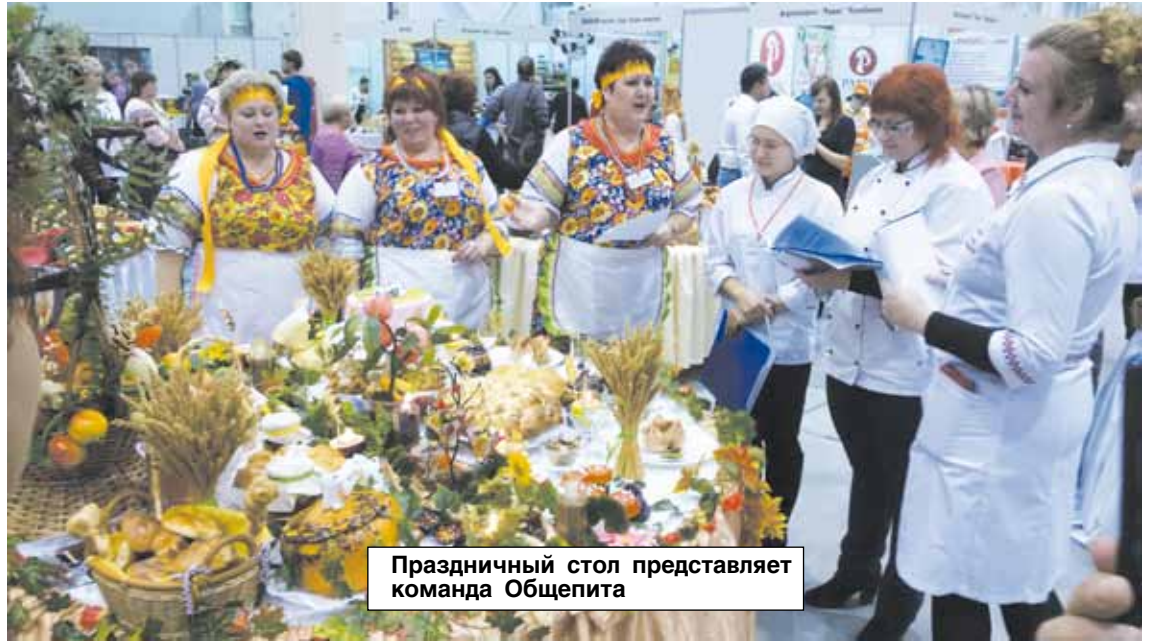
Праздничный стол представляет команда Общепита

С 9 по 11 ноября 2016 года на территории Международного выставочного комплекса «Новосибирск Экспоцентр» состоялся ряд крупных мероприятий: XXV Международная специализированная выставка продуктов питания, напитков, ингредиентов и оборудования «InterFood Siberia», XXIII Международная специализированная выставка упаковочной индустрии «Упаковка Сибири», в экспозиции которой ежегодно представлены оборудование, тара, этикетка и упаковка, Международная агропромышленная выставка «АгроСиб» и выставка-демонстрация агропромышленного комплекса Новосибирской области «Дни урожая».