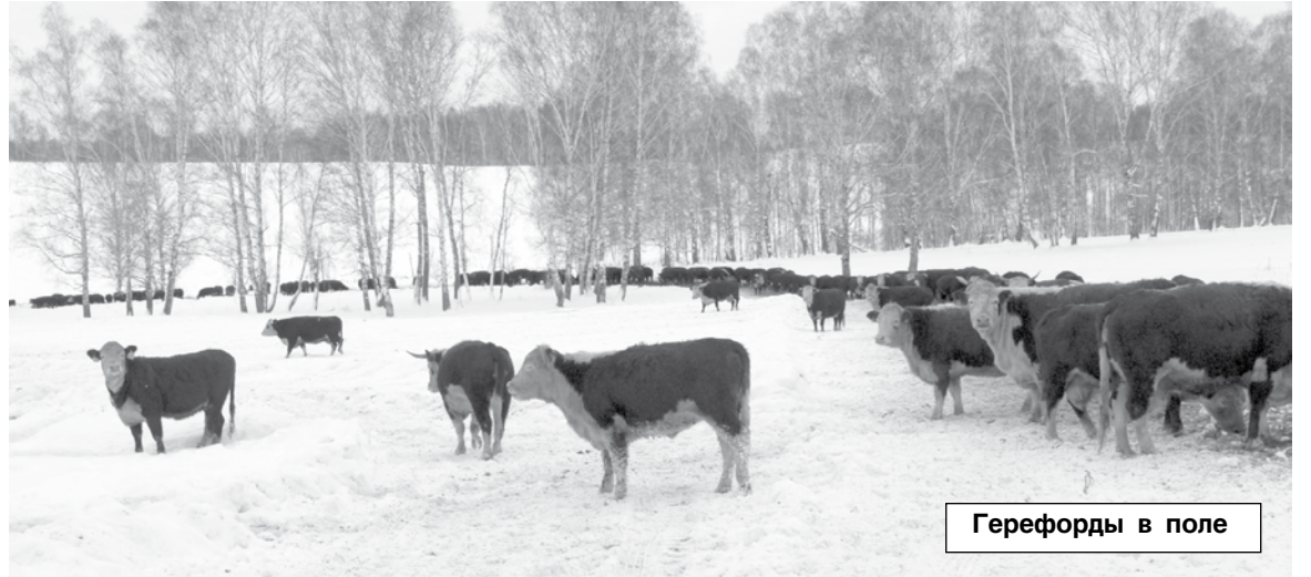
Герефорды в поле

рентабельным занятием. Пока вашему корреспонденту были представлены две возможные цифры: увеличить поголовье герефордов в «Сибирской Ниве» до 1500 голов. Её, как мне сказали, озвучил один из представителей холдинга «ЭкоНива». В самом хозяйстве прогноз по конечной величине стада скромнее - 1000 голов.