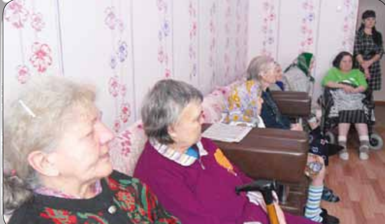
8 декабря пациенты Березовского хосписа встречали гостей - артистов районного Дома культуры, которые подарили минуты радости и позитива.