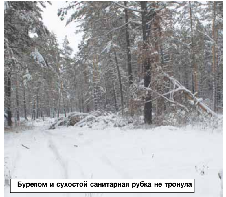
Бурелом и сухой санитарная рубка не тронула

Участок порубки находится в лесосеке, взятой по договору купли-продажи у представителя государства (департамент лесного хозяйства области) акционерным обществом «Маслянинский лесхоз». И, по некоторым данным, уже лесхоз за нехваткой собственных мощно-