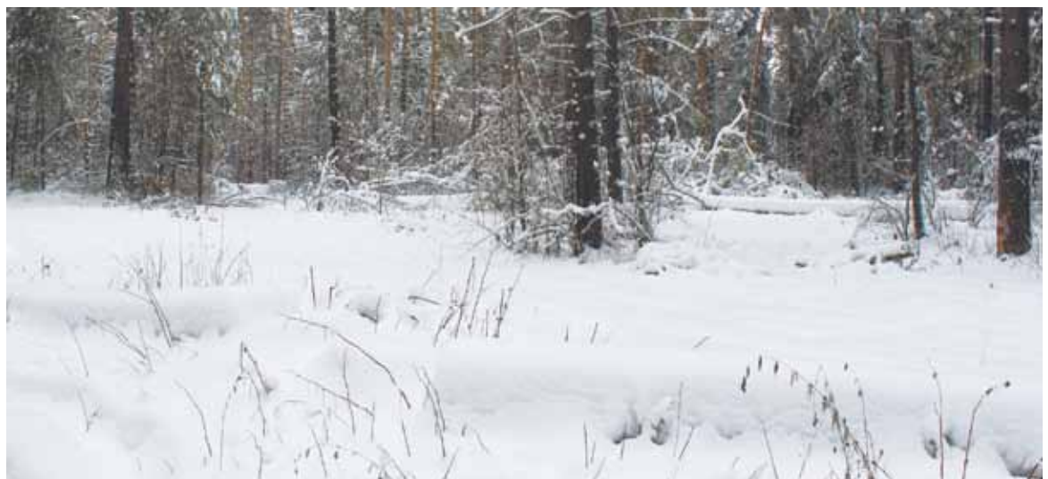
Снегом припорошены следы незаконной рубки. Но даже сугробы не скрывают полностью того, что деревья под топор пошли самые что ни на есть качественные