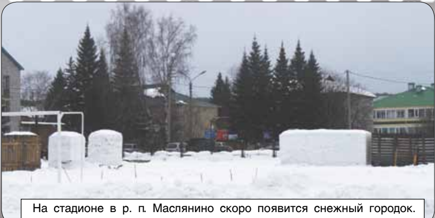
На стадионе в р. п. Маслянино скоро появится снежный городок.