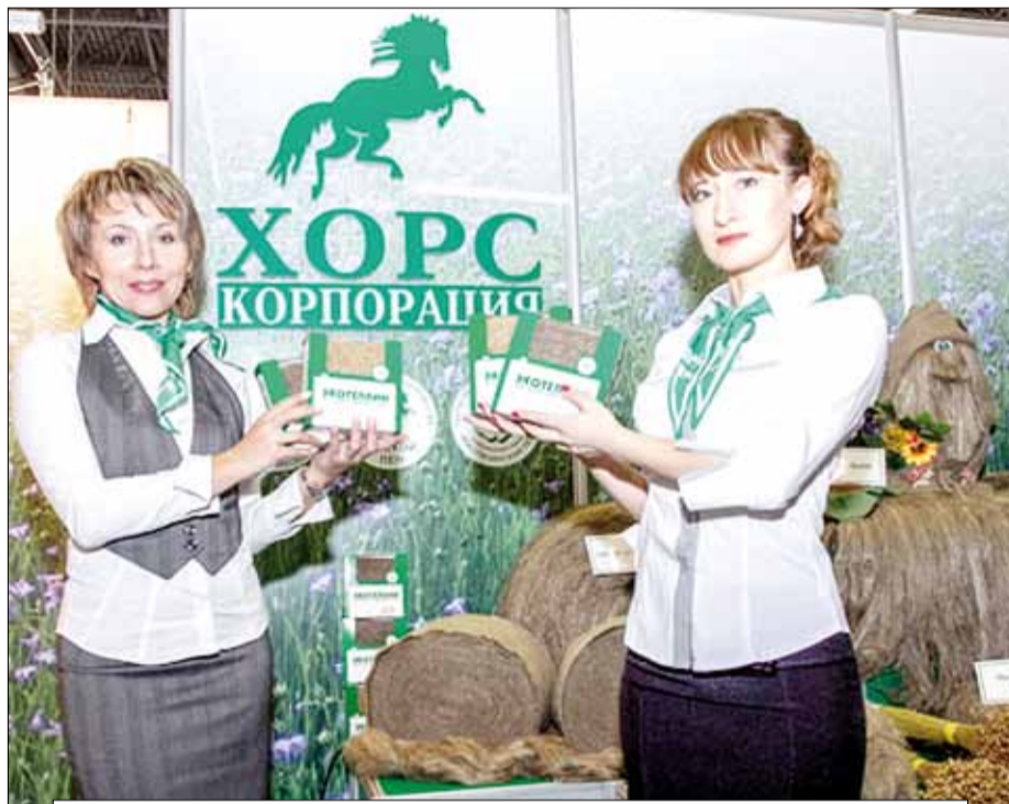
На недавно прошедшем строительном форуме BalticBuild в Санкт-Петербурге льняной теплозвукоизоляционный материал «Экотеплин» признан лучшей инновационной разработкой в России. Его производитель — новосибирская компания «ХОРС» — отмечает в этом году своё 15-летие.

— Как ни странно, это элитный продукт, а первыми его «раскусили» пенсионеры — люди с жизненным опытом. Безусловно, наша новая продукция пользуется особым спросом у тех, кто за-