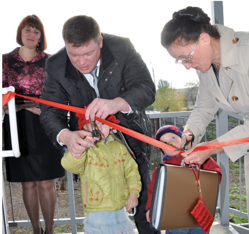
Средняя школа № 2.

Мы, родители, благодарны за такой дорогой подарок нашим детям. Надеемся, что наши малыши с радостью будут спешить сюда каждое утро, а в лице воспитателей мы найдем своих единомышленников».