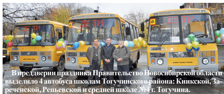
В преддверии праздника Правительство Новосибирской области выделило 4 автобуса школам Тогучинского района: Книжской, Зареченской, Рельевской и средней школе № 4 г. Тогучина.

В теплое, по-семейному уютное торжество прозвучало много слов признательности нашим учителям, исполнены танцы, песни, стихи. Это был праздник для всех, потому что со школой связаны самые теплые воспоминания.