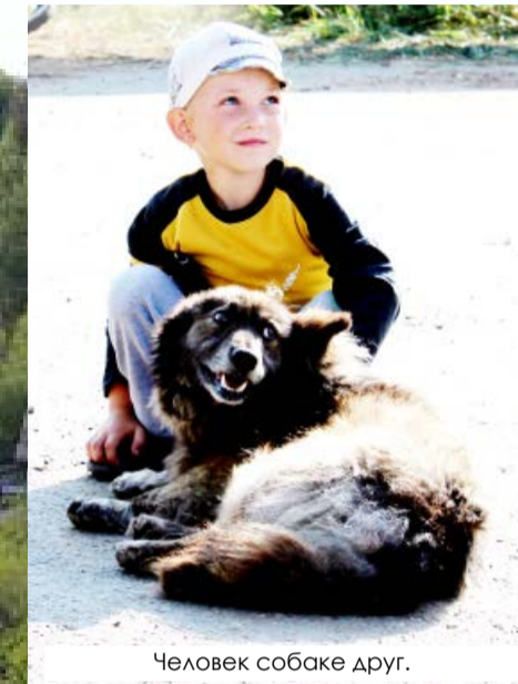
Человек собаке друг.