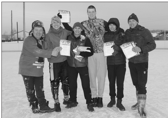
Сборная Качуга «Юниор» - победители встречи