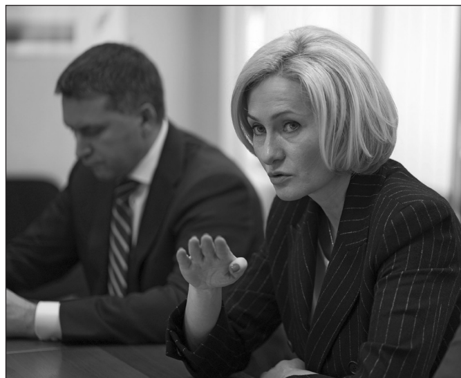
Виктория Абрамченко: «На территории Байкальска необходимо создать специальную экологическую зону»

Окончательную ликвидацию отходов БЦБК планируют