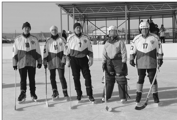
Команда ветеранов хоккея «Лена»