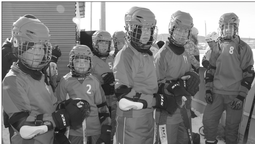
Большетарельцы приехали в Качуг в полном хоккейном снаряжении