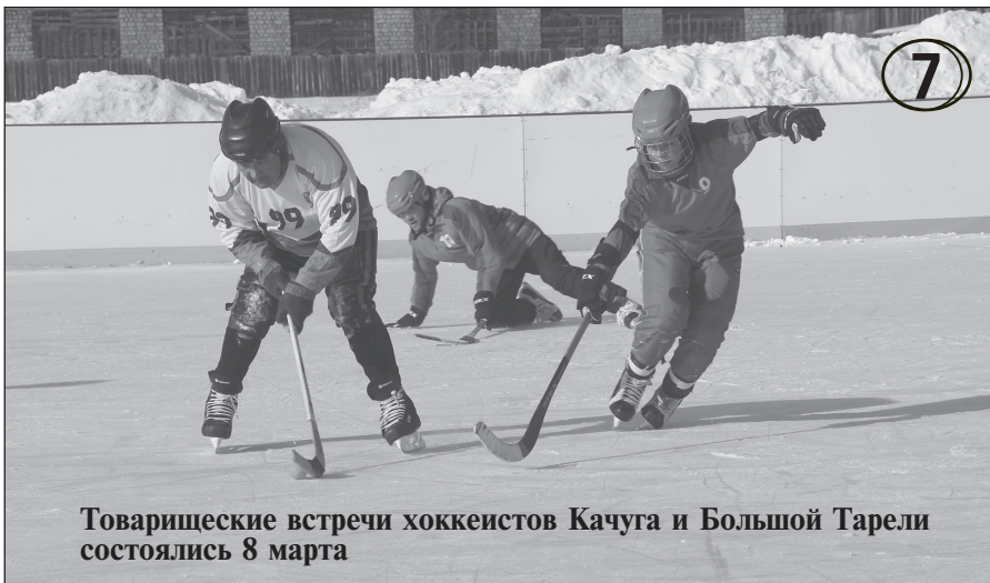
Товарищеские встречи хоккеистов Качуга и Большой Тарели состоялись 8 марта