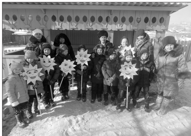
На территории Комплексного центра