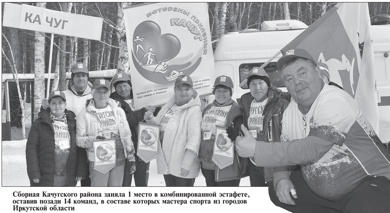
Сборная Качугского района заняла 1 место в комбинированной эстафете, оставив позади 14 команд, в составе которых мастера спорта из городов Иркутской области