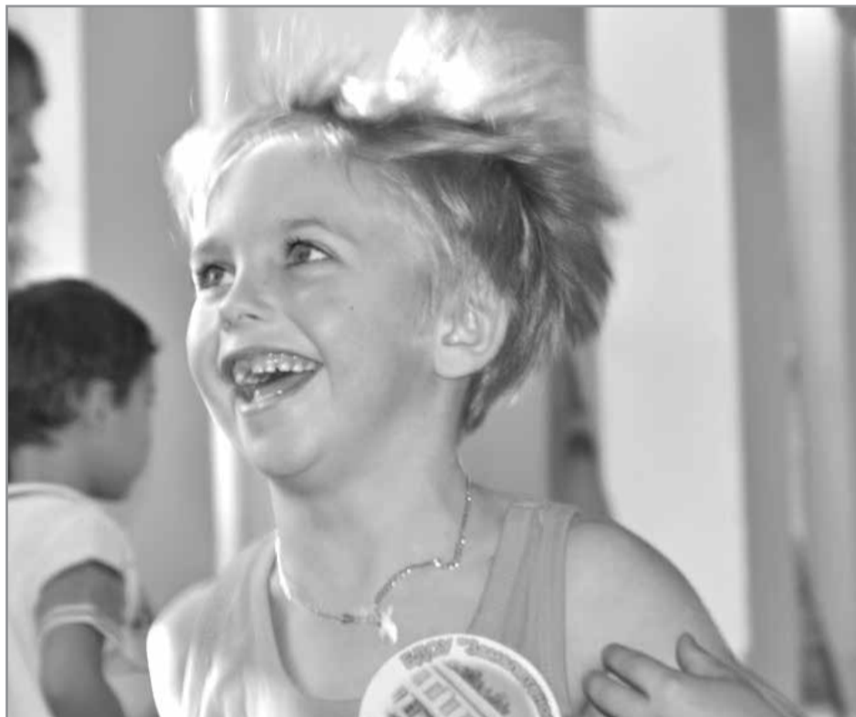
Вперёд, к победе!