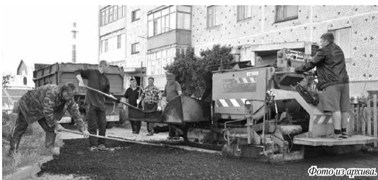
Работники Любинского ДРСУ ведут ремонт дворовых территорий.

Ведутся работы по летнему и зимнему содержанию дорог местного значения, на которые предусмотрено более 2 млн рублей из районного и поселенческих бюджетов. Кроме того, выполнены