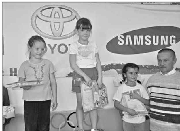
Победители эстафеты среди девочек.