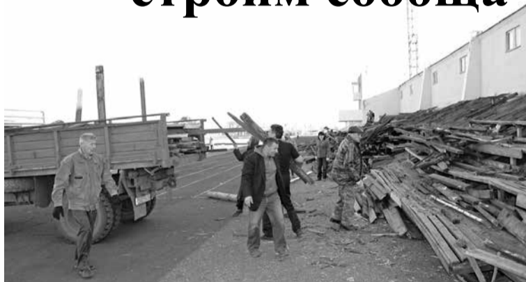
В субботу, 13 октября, на стадионе «Нива» состоялся первый общественный субботник.

Вопрос аварийного состояния спортивной трибуны на стадионе «Нива» обсуждался 12 октября с руководителями организаций и учреждений, депутатами районного Совета, представителями спортивной общественности, партии «Единая Россия» и районной ветеранской организации.