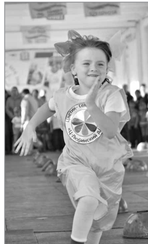
Нас не догонишь...