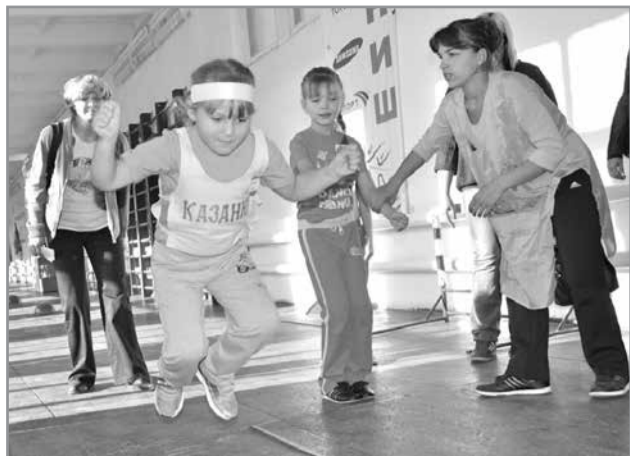
С места прыгнуть - не слабо!