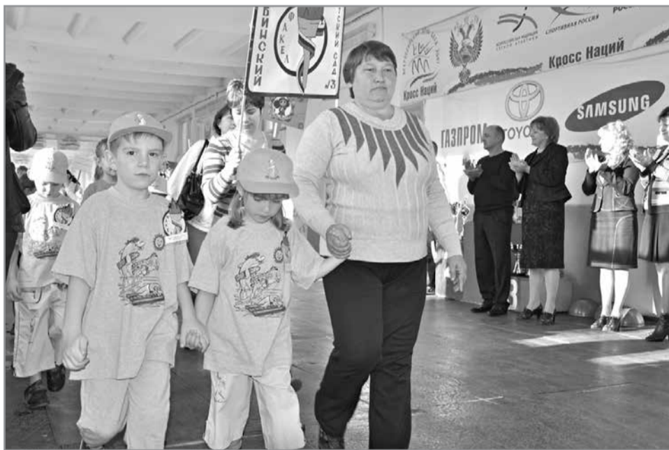
У каждого детского сада своя спортивная форма с логотипом.