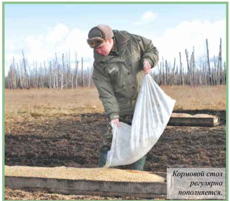
Кормовой стол регулярно пополняется.