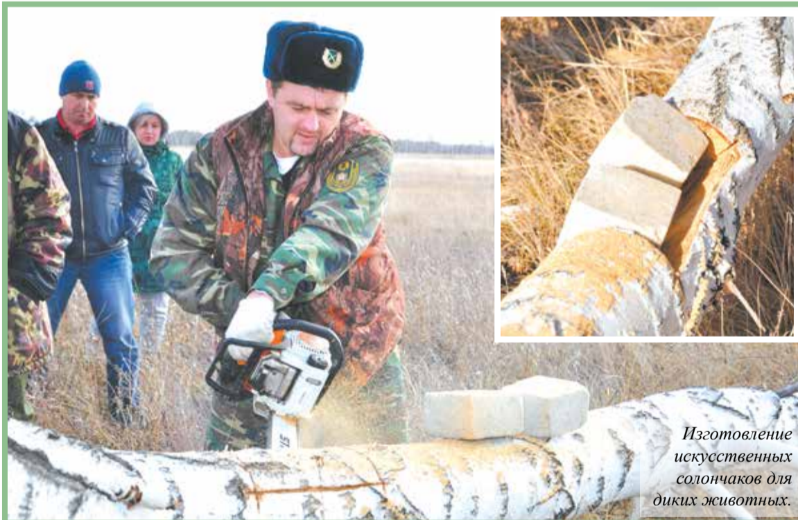
Изготовление искусственных солончаков для диких животных.