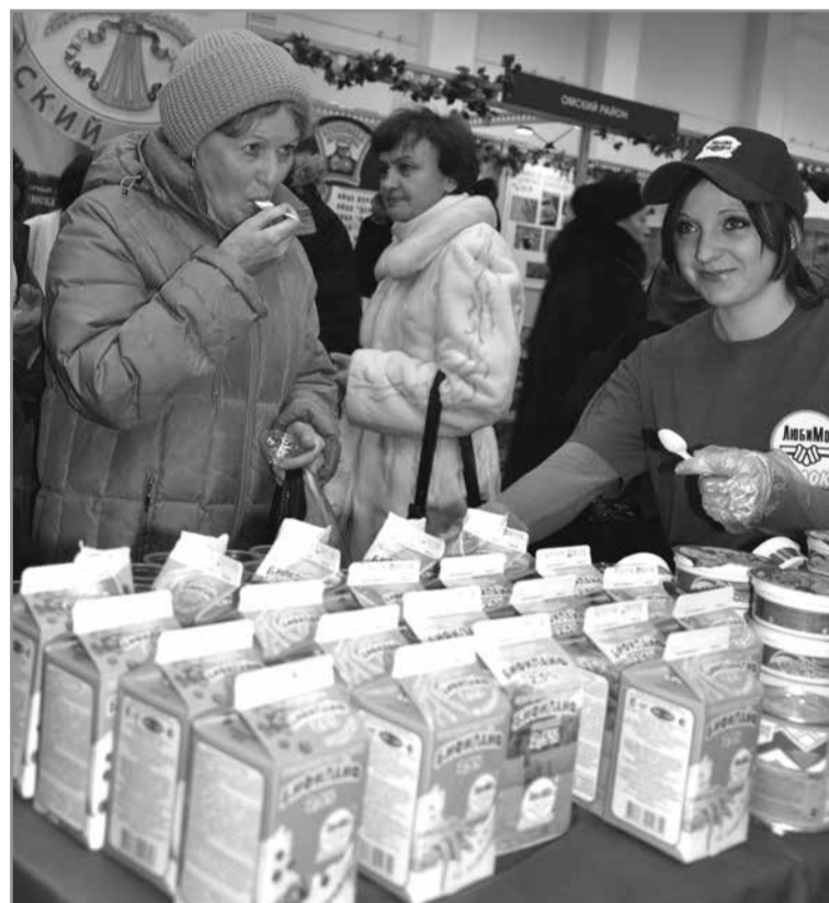
Любинский молочноконсервный комбинат, наряду с другими предприятиями района, является постоянным участником Сибирской агропромышленной недели. Его продукция пользуется повышенным спросом у жителей Омска и Омской области (фото из архива, 2012 г.).

ярмарке представлено более 10 новинок от предприятий-производителей. Так, мясоперерабатывающий комплекс «Компур»