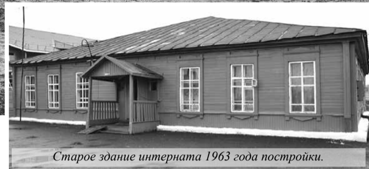
Старое здание интерната 1963 года постройки.