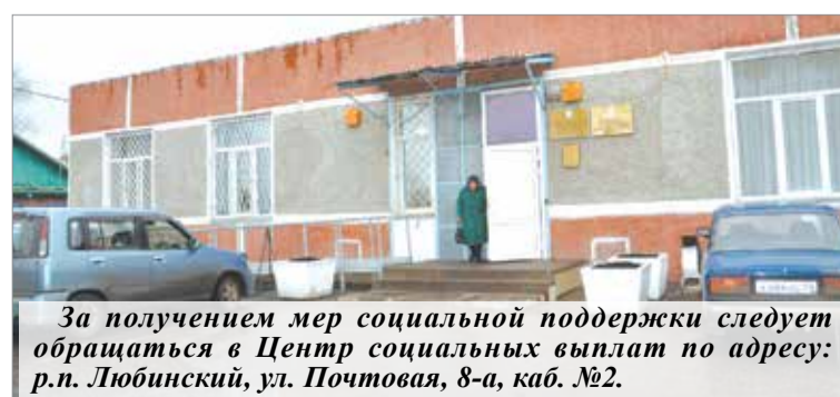
За получением мер социальной поддержки следует обращаться в Центр социальных выплат по адресу: р.п. Любинский, ул. Почтовая, 8-а, каб. №2.

154 855 рублей составили социальные выплаты гражданам - участникам программы «Оказание содействия добровольному переселению в Омскую область соотечественников, проживающих за рубежом», переехавшим в Любинский район в 2012 году.