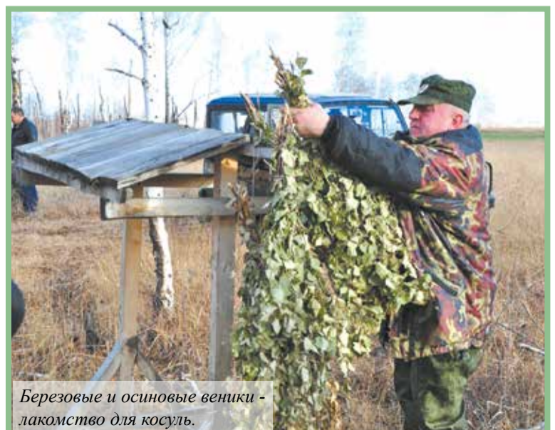
Березовые и осиновые веники - лакомство для косуль.