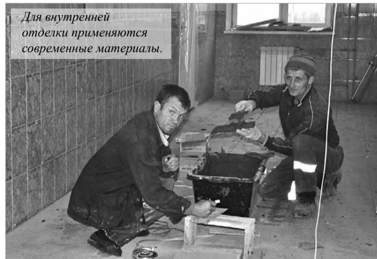
Для внутренней отделки применяются современные материалы.