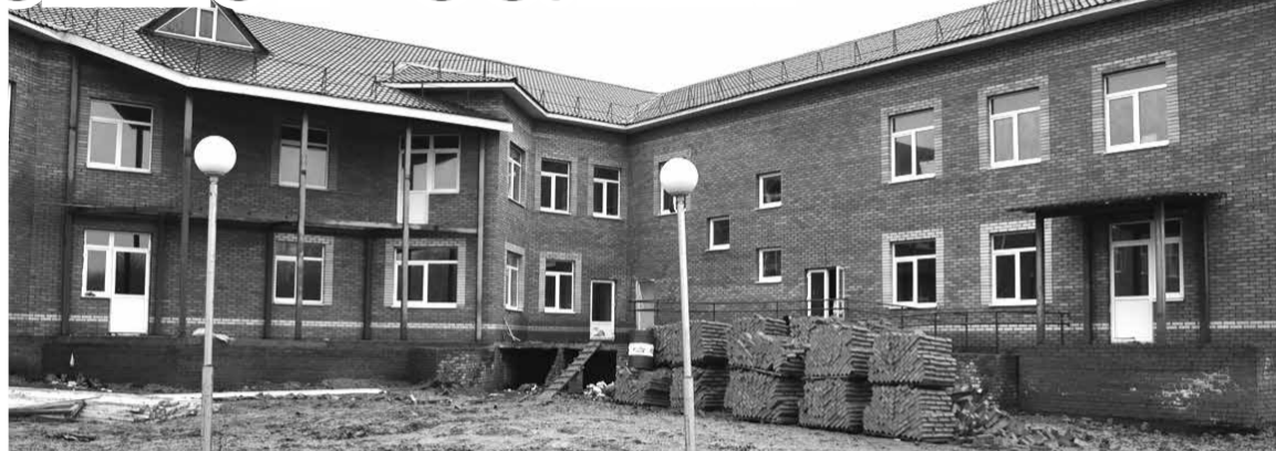
Новый корпус распахнёт двери для пациентов интерната в 2014 году.

Для граждан, передвигающихся на инвалидных колясках, а именно эта категория больных будет проходить здесь лечение, устанавливаются пандусы и два грузовых лифта. Ввести корпус в