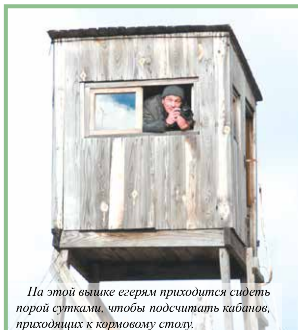
На этой вышке егерям приходится сидеть порой сутками, чтобы подсчитать кабанов, проходящих к кормовому столу.