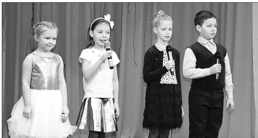
Юные участники концерта.

С фойе Дома культуры всё говорило о празднике. Здесь была размещена выставка детских рисунков «Мамин портрет», а сотрудники центральной библиотеки провели для всех желающих мастер-класс по изготовлению цветов из бумаги «Подарок маме».