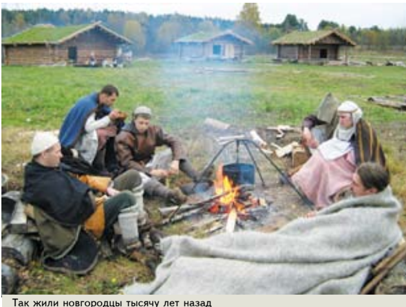
Так жили новгородцы тысячу лет назад

торговли и ремесел. Могущественный Ганзейский союз зародился из торговли шведского острова Готланд с Новгородом. И нам особенно приятно, что международное сотрудничество в рамках «Ганзейского Союза Нового времени» продолжается и сейчас, а в июне этого года Великий Новгород станет центром проведения уникального международного форума — XXIX Ганзейских дней Нового времени, который соберет представителей более ста городов из пятнадцати европейских стран. Это абсолютно новый формат деловых и культурных мероприятий, обусловленный, прежде всего, тем большим значением,