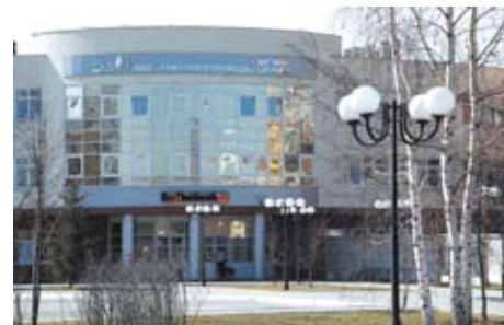
Здание администрации ОАО «Уралэлектромедь»

изводства. Требуется системной поддержки внедрение импортозамещающих производств. Критерием работы органов власти, по словам Андрея Козицына, должно стать расширение налогооблагаемой базы. Также он обратил внимание на необходимость создать механизм потребительского кредитования: «Людьми достаточно предложить достойную работу и гарантию стабильности — остальное они сделают сами». ■