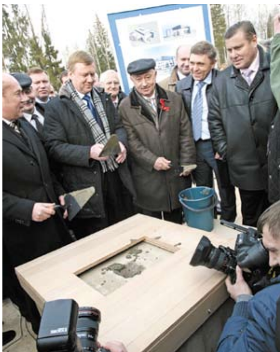
Анатолий Чубайс на закладке первого камня в фундамент научно-производственного комплекса «Бета»

— Область и, в частности, наше министерство промышленности и науки, уже несколько лет занимаются созданием инфраструктуры инновационной деятельности. Наш регион — пилотный, на нем отработывается система, которую можно будет применить в масштабе всей страны. Организованы сеть бизнес-инкубаторов, инновационно-технологических центров, Международный центр технологической кооперации, создан региональный сегмент Всероссийской электронной биржи интеллектуальной собственности, другие звенья инновационной сети. Все это может использоваться и для развития нанотехнологий. Конкретно же ради них в Троицке, например, реализуется проект создания головной научной организации по направлению углеродных нанотехнологий. В Щербинке ведется строительство Центра нанокерамических материалов и мембран. Во Фрязино создан инновационно-технологический центр разработок в области нанотехнологий и информатики.