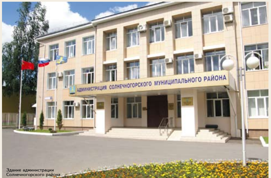
Здание администрации Солнечногорского района

— Должен сказать, что в этом отношении наш район достаточно благополучен: задержек по зарплате в бюджетной сфере у нас нет, на предприятиях несвоевременные