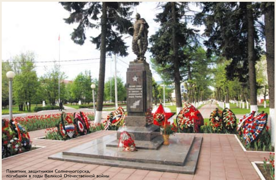
Памятник защитникам Солнечногорска, погибшим в годы Великой Отечественной войны

Для меня очень важно, чтобы жизнь в нашем районе наладилась, ведь здесь я родился, вырос, прожил всю свою жизнь. И я сделаю все, чтобы людям здесь жилось хорошо, чтобы каждый житель района на вопрос: «Где вы живете?», с гордостью отвечал: «В Солнечногорье!»