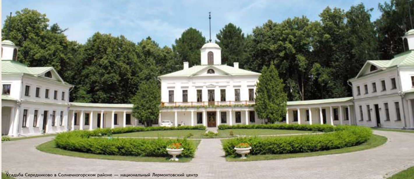
Усадьба Середниково в Солнечногорском районе — национальный Лермонтовский центр

С олнечногорский муниципальный район расположен на северо-западе Московской области. Как самостоятельная административная единица он образован в 1929 году. В состав района входят пять городских и шесть сельских поселений.