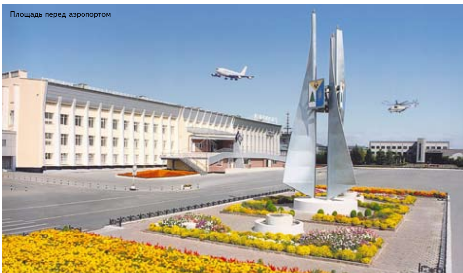
Площадь перед аэропортом

Для персонала созданы комфортные условия труда, поддерживается высокий уровень заработной платы. Есть своя медсанчасть, база отдыха, комбинат питания, стадион. Для повышения квалификации персонала организован собственный учебно-тренировочный центр, который имеет сертификат и лицензию на подготовку не только собственных кадров, но и специалистов для других предприятий. Центр располагает солидной материально-технической базой, учебно-лабораторным оборудованием, современными средствами обучения.