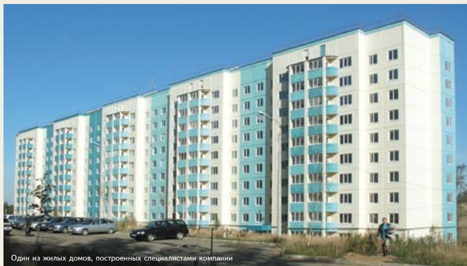
Один из жилых домов, построенных специалистами компании

Кстати, коллектив ООО «СМУТАРМ» — это дружный и слаженный «союз» квалифицированных рабочих и профессиональных работников и об этом я говорю с особой гордостью. Ведь не даром девиз нашего предприятия — «Устремленность со знанием дела!» Сотрудники компании регулярно проходят обучение в центрах дополнительного профессионального образования, имеют сертификаты системы «ТРАСТЕСТ».