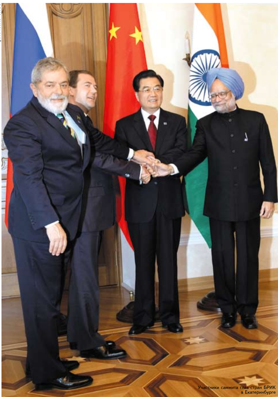
Участники саммита глав стран БРИК в Екатеринбурге