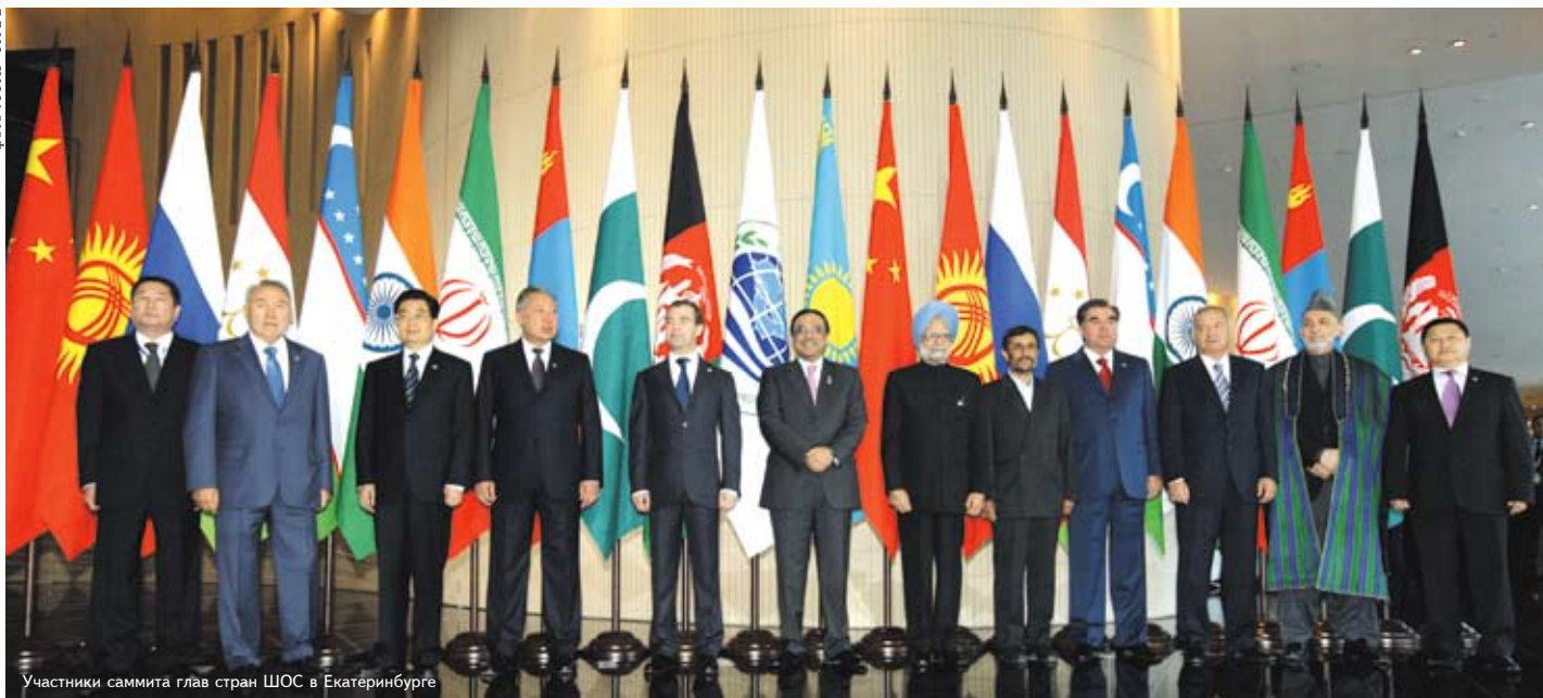
Участники саммита глав стран ШОС в Екатеринбурге

15 и 16 июня в Екатеринбурге прошли сразу два больших международных мероприятия — саммиты глав стран ШОС и БРИК.