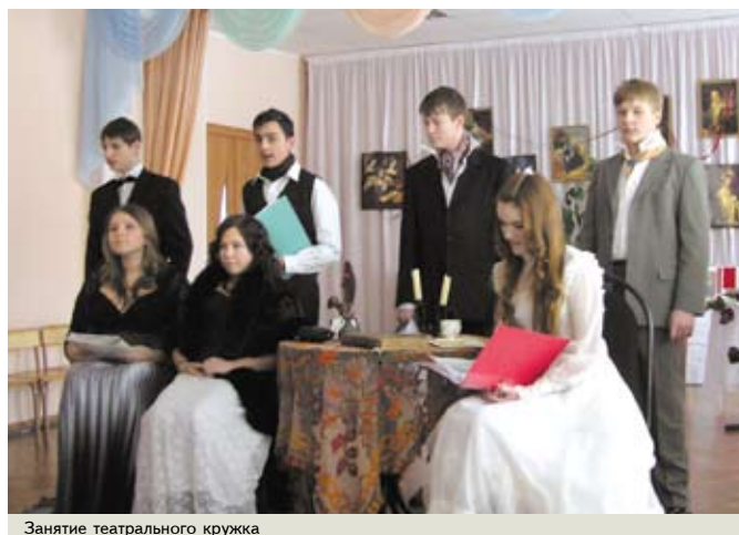
Занятие театрального кружка

Традиционные праздники школы «Ренессанс»: День знаний, посвящение в ученики школы «Ренессанс», День учителя, новогодние конкурсные мероприятия школы, конкурс проектов, театральные встречи на русском и английском языках, концерты на английском языке, День рождения школы, Последний звонок.