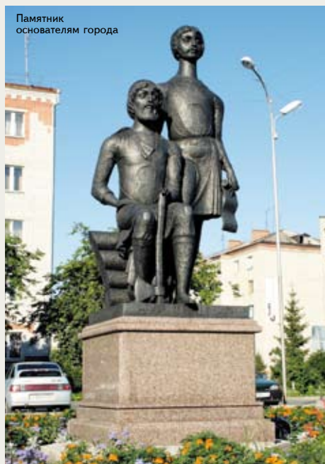
Памятник основателям города

Сданы в эксплуатацию жилой 140-квартирный дом, автовокзал, Ледовый Дворец с искусственным льдом, ведется капитальный