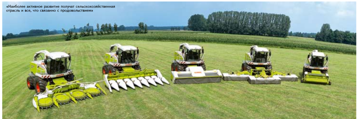
«Наиболее активное развитие получают сельскохозяйственная отрасль и все, что связано с продовольствием»

Момент перелома, неопределенности заставляет регионы открыть глаза, а не повторять, как заклинание дежурные мантры: «Кризис-кризис, инвестиции-инвестиции...». Если регион отчетливо видит свои уникальные преимущества и принимает решение — это его стратегический выбор. Адекватными мерами можно удержать и развить конкурентное преимущество по научно-техническому потенциалу, квалификации кадров, по другим направлениям, и тем самым заложить основы для дальнейшего роста экономики, приостановить падение жизненного уровня населения. Но если внешние или внутренние условия изменились и ранее принятые решения перестают работать, их пересматривают — это и называют стратегическим планированием. Политика должна основываться на нем. Думаю, что в ближайшее время этот процесс будет отлажен. ■