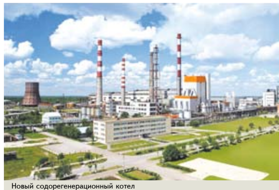
Новый сордорегенерационный котел