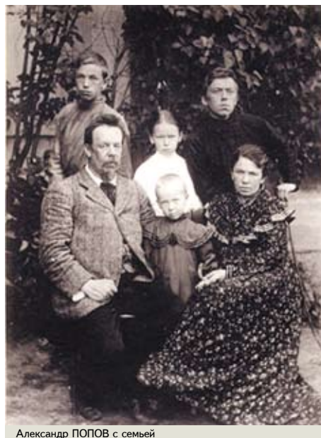
Александр ПОПОВ с семьей

Первые научные исследования Попова были посвящены анализу наиболее выгоднейшего действия динамоэлектрической машины (1883 год) и индукционных весов Юза (1884-й). После опубликования в 1888 году работ Герца по электродинамике Попов стал изучать электромагнитные явления и прочитал серию публичных лекций на тему «Новейшие исследования о соотношении между световыми и электрическими явлениями». Пытаясь найти способ эффективной демонстрации опытов Герца перед большой аудиторией, Попов занялся конструированием более наглядного индикатора электромагнитных волн, излучаемых вибратором Герца. Хорошо понимая потребность русского флота в средствах беспроводной сигнализации, он в начале 1890-х годов поставил перед собой также задачу использовать электромагнитные волны для сигнализации.