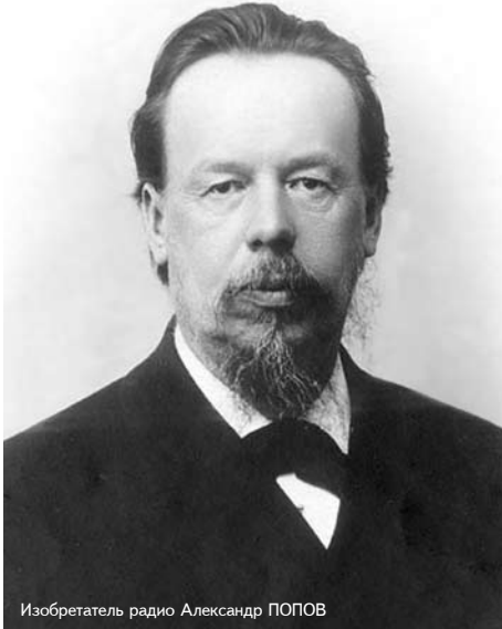
Изобретатель радио Александр ПОПОВ