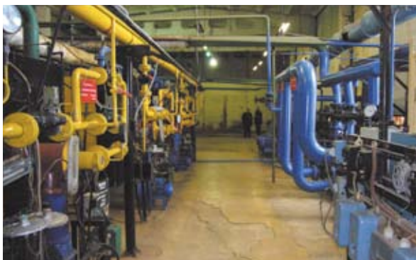
Котельная поселка Шабурново

Профсоюз заботится о тружениках коллектива. И сами работники, и их дети отдыхают в санаториях, домах отдыха, детских оздоровительных лагерях. Отдохнувший, здоровый работник, уверенный в своем будущем, — главная наша ценность. ■