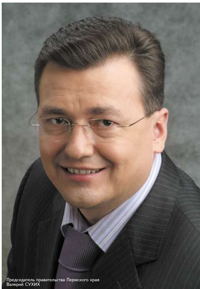
Председатель правительства Пермского края Валерий СУХИХ

Всего на муниципальный уровень с регионального были переданы с 1 января 2009 дополнительно 10 процентов подоходного налога, 70 процентов налога на имущество организаций и 100 процентов транспортного налога. По расчетам министерства финансов, в результате вносимых изменений увеличиваются доходы всех городов и районов, только в разной степени. Больше всех выигрывают города Пермь, Березники и Соликамск, которые выходят из разряда дотационных, а также Ординский, Уинский,