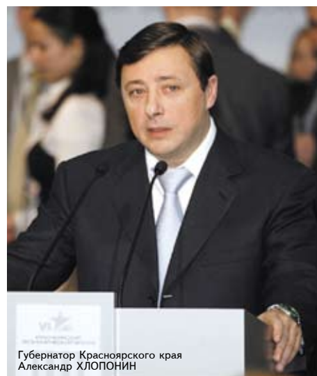
Губернатор Красноярского края Александр ХЛОПОНИН

Оценка нынешнего экономического состояния страны устами Александра Жукова была обнадеживающей: «Сегодня мы располагаем достаточными ресурсами для поддержания ключевых секторов экономики, конкурентоспособности российских предприятий. Приток капитала и новых технологий в российскую экономику является настоящим серьезным достижением». Но, обозначая задачи на перспективу, он также сказал, что «кризис — это наш шанс модернизировать все сферы социальной и экономической жизни, что позволит выйти из кризиса с конкурентоспособной экономикой». Какими путями? Вице-премьер определил ключевые направления дискуссионных площадок. Их темы в программе форума были сформулированы, как «Финансовая политика в условиях кризиса», «Кого и как спасать государственными деньгами?», «Где двигатели роста?», «Чем занять себя безработному? Реструктуризация рынка труда во время кризиса»,