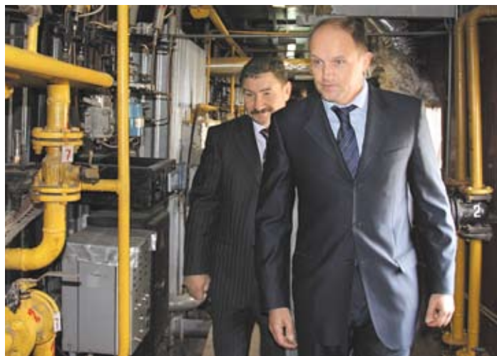
Первый заместитель главы города Челябинска Сергей ДАВЫДОВ на одном из объектов коммунального хозяйства

— Мы обратили внимание на ужасное состояние подъездов во многих домах, и поэтому выделили из городского бюджета