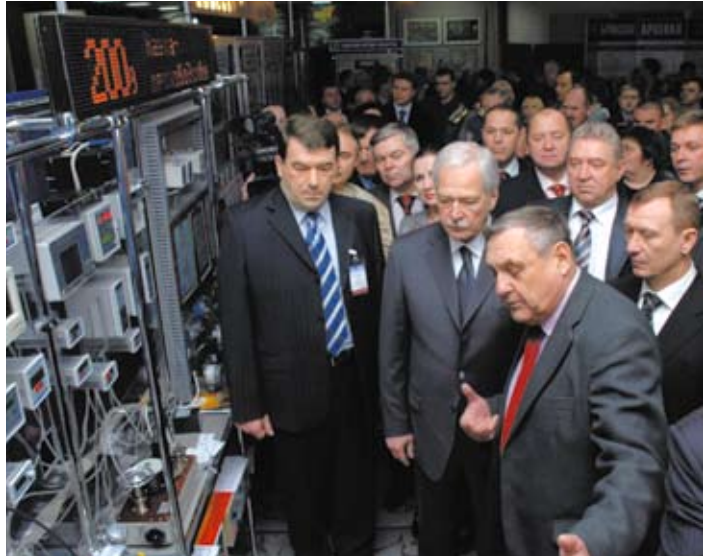
Борис ГРЫЗЛОВ и Николай ДЕНИН осматривают экспонаты выставки на Первом славянском международном экономическом форуме

— Самое активное. На карте Брянской области есть точка, где сходятся сразу три границы. В конце июня на общий праздник —