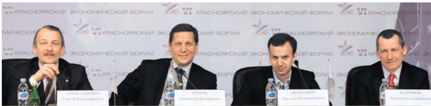
Директор по макроэкономическим исследованиям Высшей школы экономики Сергей АЛЕКСАШЕНКО, заместитель председателя Правительства Российской Федерации Александр ЖУКОВ, помощник Президента Российской Федерации Аркадий ДВОРКОВИЧ и Управляющий директор группы компаний «Тройка диалог» Андрей ШАРОНОВ