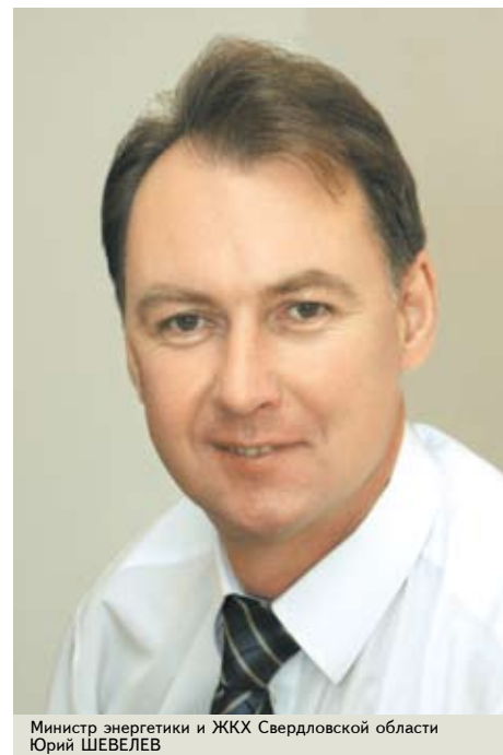
Министр энергетики и ЖКХ Свердловской области Юрий ШЕВЕЛЕВ

— Юрий Петрович, известно, что Свердловская область получит 1,6 миллиарда рублей из Фонда содействия реформированию ЖКХ. Куда будут направлены эти средства?