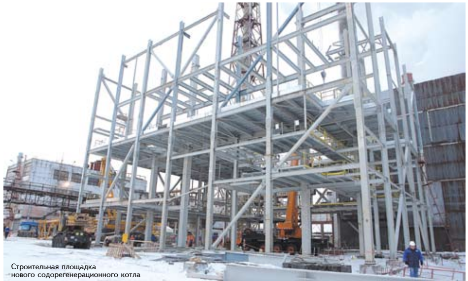
Строительная площадка нового содорегенерационного котла

«Степ» — не только производственный проект, но и экологический. В его рамках построят новую выпарную станцию мощностью 550 тонн упаренной воды в час. Ввод в строй двух градирен позволит использовать воду многократно. Новые технологии и оборудование резко сократят водопотребление на единицу продукции. В результате забор воды из реки Вычегды сократится с 339 тысяч кубометров в сутки до 206 тысяч кубометров. Экологический эффект от таких перемен в технологии будет очевиден. Новая «выпарка» и содорегенерационный котел сократят выбросы сернистых соединений на 90 процентов.