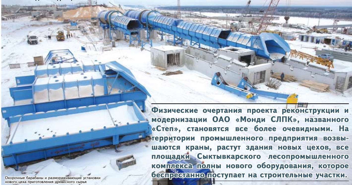
Окорочные барабаны и размораживающие установки нового цеха приготовления древесного сырья

Физические очертания проекта реконструкции и модернизации ОАО «Монди СЛПК», названного «Степ», становятся все более очевидными. На территории промышленного предприятия возвышаются краны, растут здания новых цехов, все площадки Сыктывкарского лесопромышленного комплекса полны нового оборудования, которое беспрестанно поступает на строительные участки.