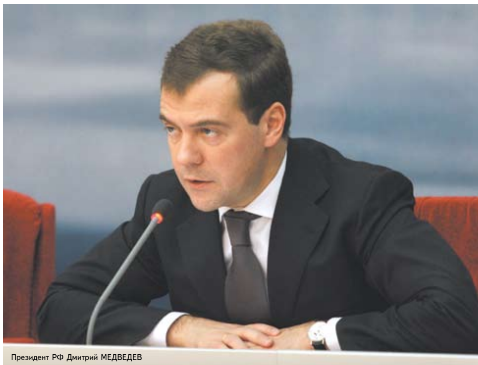
Президент РФ Дмитрий МЕДВЕДЕВ

«Жизнь не стоит на месте, — высказался Дмитрий Медведев, — и вот этот