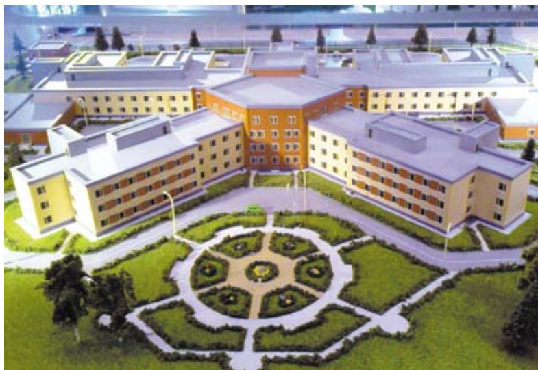
Проект федерального кардиоцентра

Прогнозируется замедление спроса на калийные удобрения, а значит, флагманы Пермской промышленности «Уралкалий» и «Сильвинит» вынуждены будут снизить объемы добычи. Но властями проведен целый ряд финансовых мероприятий по страховке от неблагоприятных экономических ситуаций. Иметь в запасе сохранный ресурс, четко выстраивать межбюджетные отношения, грамотно расходовать имеющиеся средства, не ущемляя социальную сферу, сегодня наиболее важно для преодоления существующих и грядущих потрясений экономики. ■