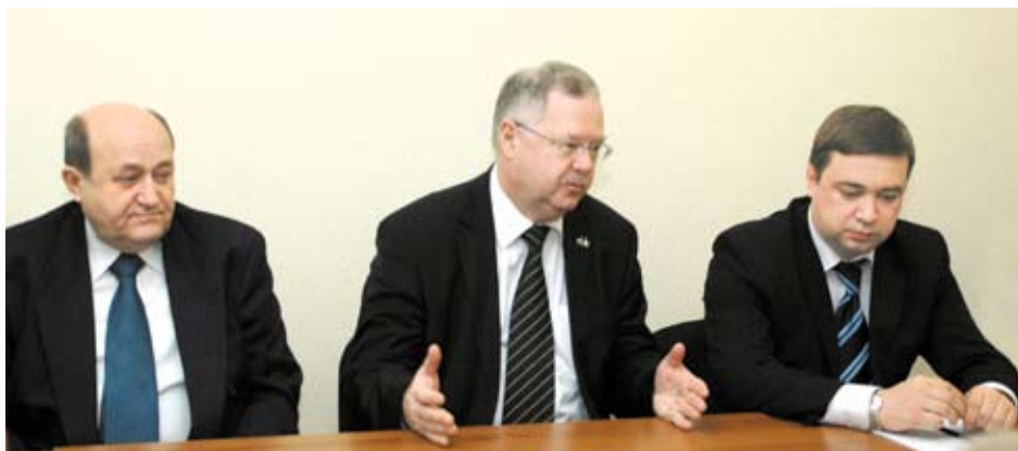
Генеральный консул Венгрии в Екатеринбурге Пал ФАБИАН, Чрезвычайный и Полномочный Посол Венгерской Республики в Российской Федерации Дьердь ГИЛИАН и министр международных и внешнеэкономических связей Свердловской области Александр ХАРЛОВ

В столице Среднего Урала прошли «Дни Венгрии». Их программа была наполнена политическими переговорами, деловыми встречами, образовательными семинарами, культурными мероприятиями, часть которых — спектакли, поставленные совместно с Будапештским театром оперетты. Вместе с тем, столь