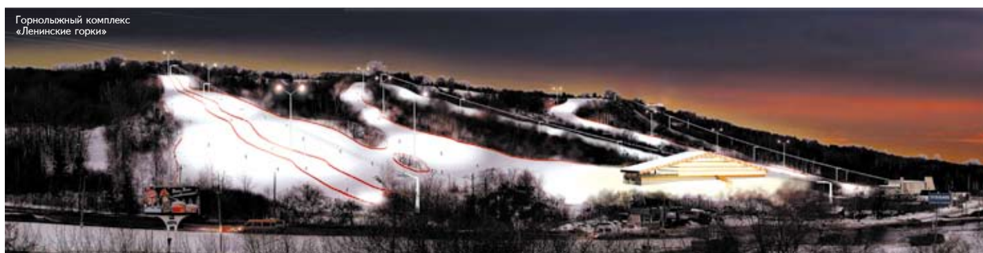
Горнолыжный комплекс «Ленинские горки»

Ульяновск имеет все возможности развиваться достойно. Одно из конкурентных преимуществ ульяновской экономики — значительный инновационный потенциал. Разработки ульяновских ученых получали награды на престижных международных выставках, салонах изобретений, инвестиций и инноваций. Ульяновск — крупный научный центр Поволжья. Среди наиболее значимых тем исследований — проблемы информатизации, конверсии, ресурсосбережения и экологии, теплоэнергетики, производства и переработки сельхозпродукции, социально-экономического развития области.