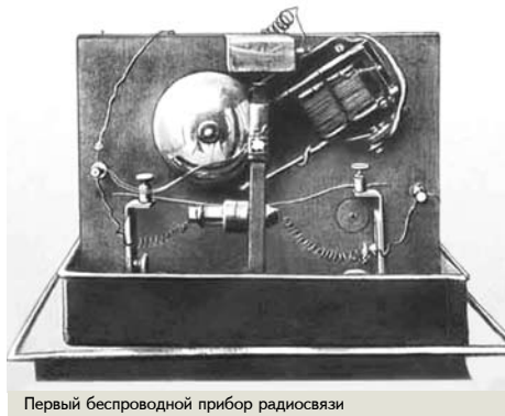
Первый беспроводной прибор радиосвязи

Много сил и времени посвятил Попов совершенствованию своего детища. Сначала передача велась всего на несколько десятков метров, потом на несколько километров, а затем на десятки километров. Экспериментируя с приборами связи, Попов обнаружил, что на их работу влияют грозные разряды. Чтобы исследовать