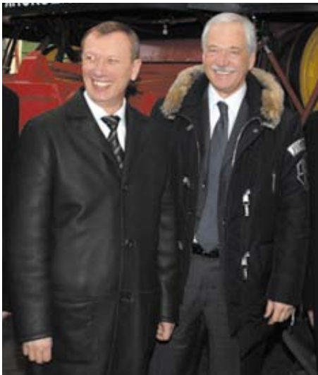
Губернатор Брянской области Николай ДЕНИН и Председатель Государственной думы РФ Борис ГРЫЗЛОВ

— На протяжении столетий на ее территории проходил процесс взаимной интеграции славянских цивилизаций. Здесь издавна удивительным образом