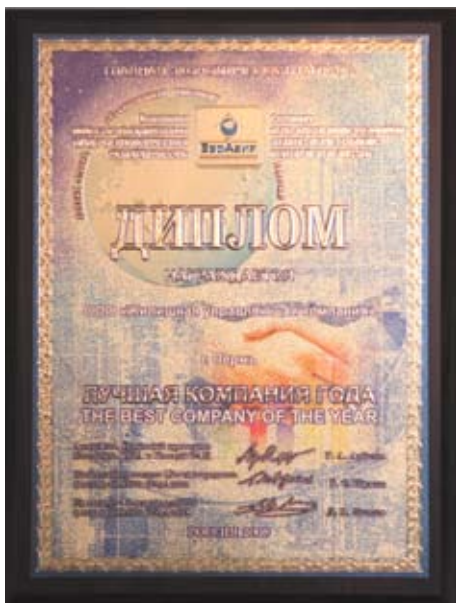
Диплом «Лучшая компания года»

— Для этих целей мы еще в 2007 году создали «Некоммерческое партнерство управляющих компаний ЖКХ». Но диалоги, которые мы проводим с ресурсоснабжающими организациями, так и остаются разговорами. Причиной может служить и то, что «хозяин» их находится не в Перми. В декабре 2008 года в рамках «круглого стола» проводилась встреча с участием