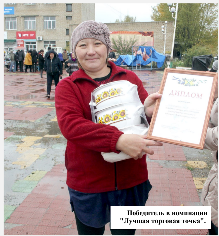
Победитель в номинации "Лучшая торговая точка".

торую производят в нашем районе, а сельхозтоваропроизводителям - получить дополнительный доход.