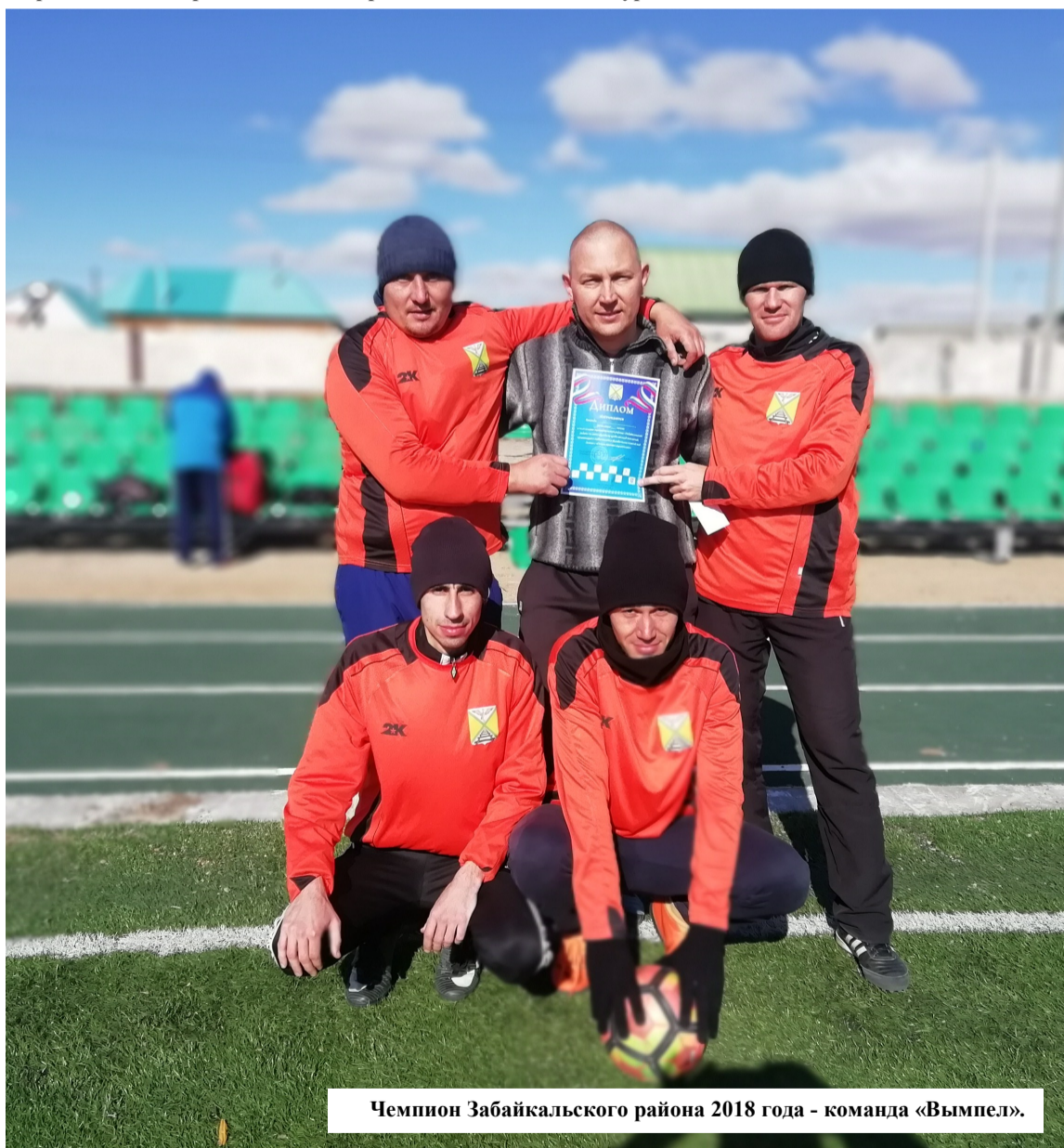
Чемпион Забайкальского района 2018 года - команда «Вымпел».

13 октября 2018 года на стадионе «Забайкалец» прошел Чемпионат Забайкальского района по мини-футболу среди команд поселений, организаций и любительских футбольных команд под девизом «Спорт против наркотиков». Соревнования прошли по круговой системе среди пяти команд, которые хорошо знают друг друга и уже не раз встречались в течение последних лет. В этом году в составе некоторых команд выступали старшкласники. Чемпионом Забайкальского района стала команда «Вымпел», на втором месте «Пограничник» и на третьем месте команда «Буревестник».