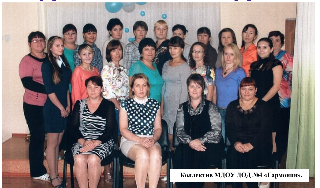
Коллектив МДОУ ДОД №4 «Гармония».

Подавляющее большинство коллектива детского сада,