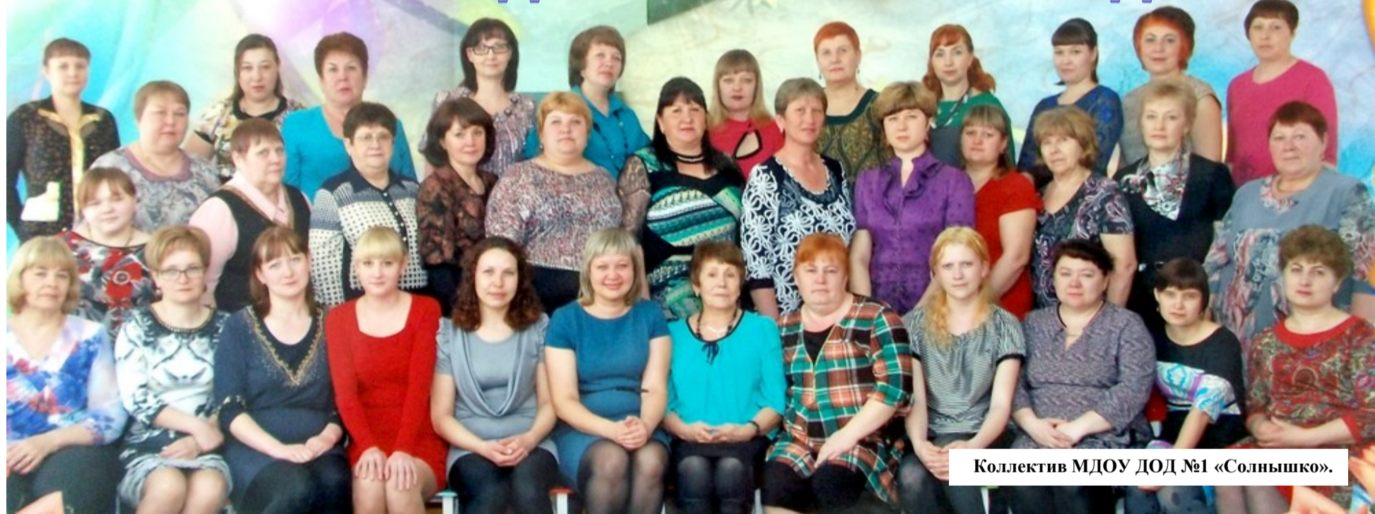
Коллектив МДОУ ДОД №1 «Солнышко».

Есть такие названия, которые сразу настраивают на радостный лад, вызывая теплые и светлые чувства. Такое же название у детского сада «Солнышко», которому в марте 2016 исполнится 25 лет.