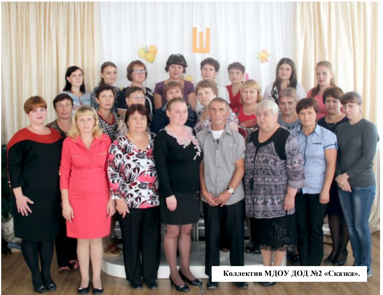
Коллектив МДОУ ДОД №2 «Сказка».

Детский сад это теплый дом, где царит семейная обстановка, где дети играют, слушают сказки, участвуют в занятиях, труде, общаются. Домашняя атмосфера, царящая в детском саду, достигнута благодаря большому дружному коллективу сотрудников ДОУ. Мы всегда рады вам и вашим малышам!