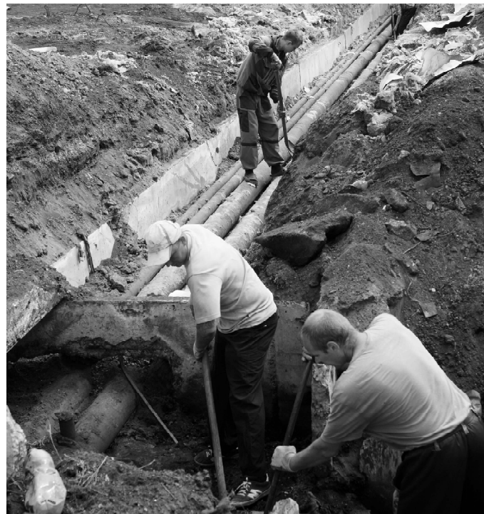
На ремонт теплоцентрали брошены все силы.