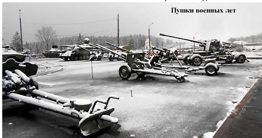
Пушки военных лет

тили в руины 209 городов и городских посёлков, 9 200 сёл и деревень, от рук захватчиков пало 2 230 000 советских граждан. ЭТО НИКОГДА НЕ БУДЕТ ЗАБЫТО – такая надпись сделана на первом мемориальном памятнике при входе на территорию бывшей деревни.