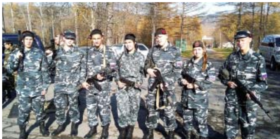
Перед этапом «Военно-тактическая игра»