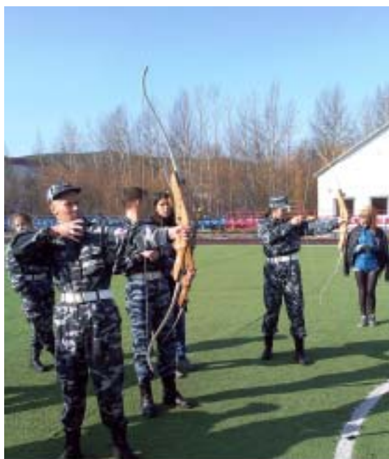
Команда «Патриот» на этапе «Стрельба из лука»

Всесоюзная «Зарница» - игра многих поколений и разных масштабов. Пионерская военно-спортивная игра в СССР представляла собой имитацию боевых действий, похожую на военные учения. В ходе игры пионеры делились на команды и соревновались в различных военно-прикладных видах спорта с игровыми элементами. Игра являлась частью системы начальной военной подготовки школьников в СССР. В настоящее время с уходом пионерских организаций из школ «Зарница» или похожие на неё игры обычно проводятся