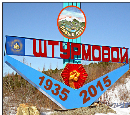
(Продолжение. Начало в “СП” № 49.)