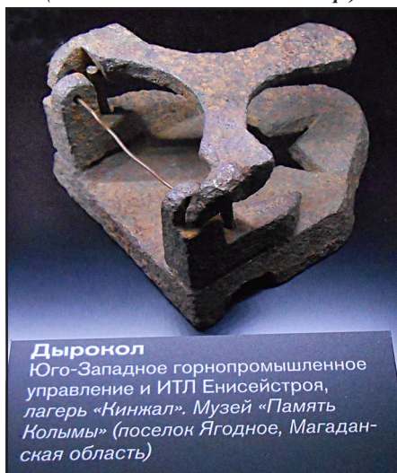
Дырокол Юго-Западное горнопромышленное управление и ИТЛ Енисейстроя, лагерь «Кинжал». Музей «Память Колымы» (поселок Ягодное, Магаданская область)

Сегодня в музее много архивных документов, писем и воспоминаний бывших узников лагерей, произведений искусства и просто рисунков, созданных художниками и простыми людьми, прошедшими через лагеря, различных вещей, принадлежавших заключённым.