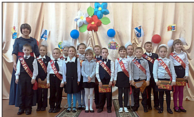
Посвящение в первоклассники

Уже мало солнца и тепла, но, кажется, вот-вот произойдет что-то новое и прекрасное. С таким настроением я вошла в свою любимую школу.