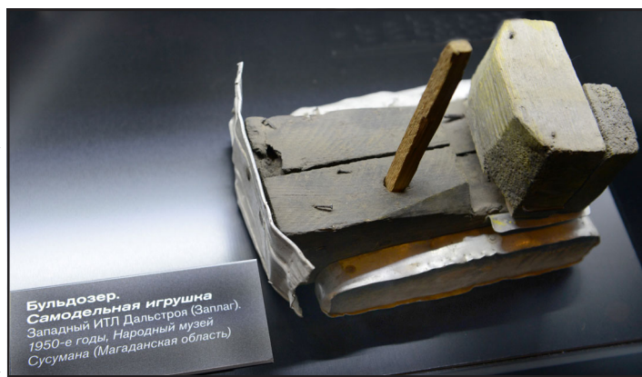
Бульдозер. Самодельная игрушка Западный ИТЛ Дальстроя (Заплаг), 1950-е годы, Народный музей Сусумана (Магаданская область)

PS. 31 октября и 1 ноября прошёл семинар «От Соловков до Колымы: память о ГУЛАГе в музейных собраниях современной России», участники которого рассказывали о своём понимании прошлого и показывали на слайдах экспозицию своего музея, посвящённую теме ГУЛАГа.