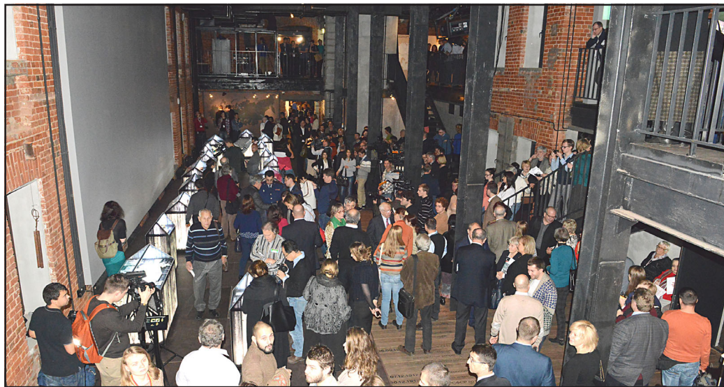
В зале Музея ГУЛАГа, Москва, 30.10. 2015 г

30 октября – в День памяти жертв политических репрессий – в Москве состоялось открытие Музея истории ГУЛАГа. Точнее – новоселье, так как музей переехал с Петровки-16 в просторное четырёхэтажное здание. Людей было очень много, причём не только москвичей, но и из других регионов России, в том числе и с далёкой Колымы.