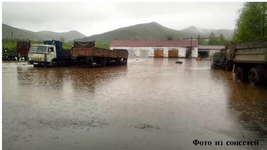
Фото из соцсетей