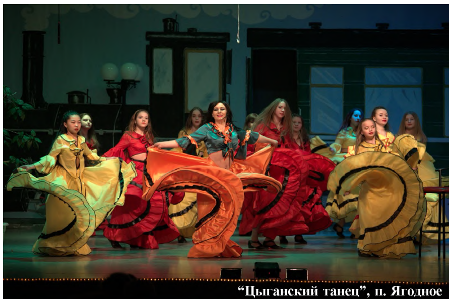
“Цыганский танец”, п. Ягодное