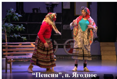
“Пенсия”, п. Ягодное