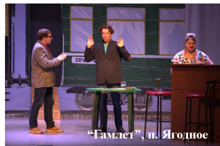
“Гамлет”, п. Ягодное

Вновь голос диспетчера: «Внимание! Внимание! Сенсация! К нам прибывает... Верка Сердочка!!! Со своей шоу-группой! Встречайте!!!» Возбуждающая