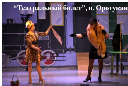
“Театральный билет”, п. Оротукан