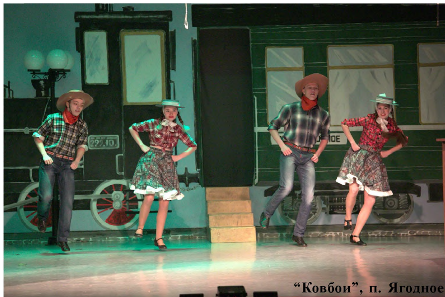
“Ковбой”, п. Ягодное

На поезде прибыли творческие группы из детской школы искусств, центра детского творчества п. Ягодное, славных «градов» Дебин и Оротукан, и, конеч-