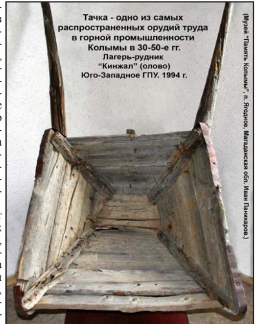
Тачка - одно из самых распространённых орудий труда в горной промышленности Колымь в 30-50-е гг. Лагерь-рудник "Кинжал" (олово) Юго-Западное ГПУ. 1994 г.

Ну и последняя из экспозиций, которую может созерцать посетитель, – немые свидетели прошлого. То есть вещи лагерной эпохи, а именно: орудия труда заключённых (тачка, кайло, лоток и т. д.), предметы быта и одежда (нары, тумбочка, кухонная посуда из консервных банок, бушлат, роба, обувь и т. п.), орудия угнетения (наручники, ствол от винтовки, штык, бля-