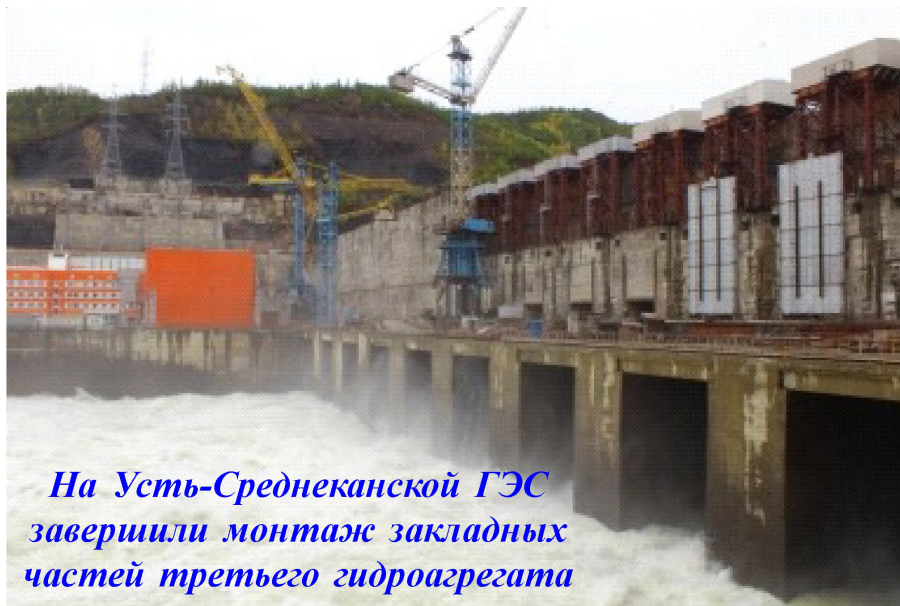
На Усть-Среднеканской ГЭС завершили монтаж закладных частей третьего гидроагрегата

“Правительству РФ при участии “Русгидро” рассмотреть вопрос о финансировании работ по подготовке ложа водохранилища Усть-Среднеканской ГЭС. Доклад – до 15 ноября 2017 года”, — говорится в поручении.