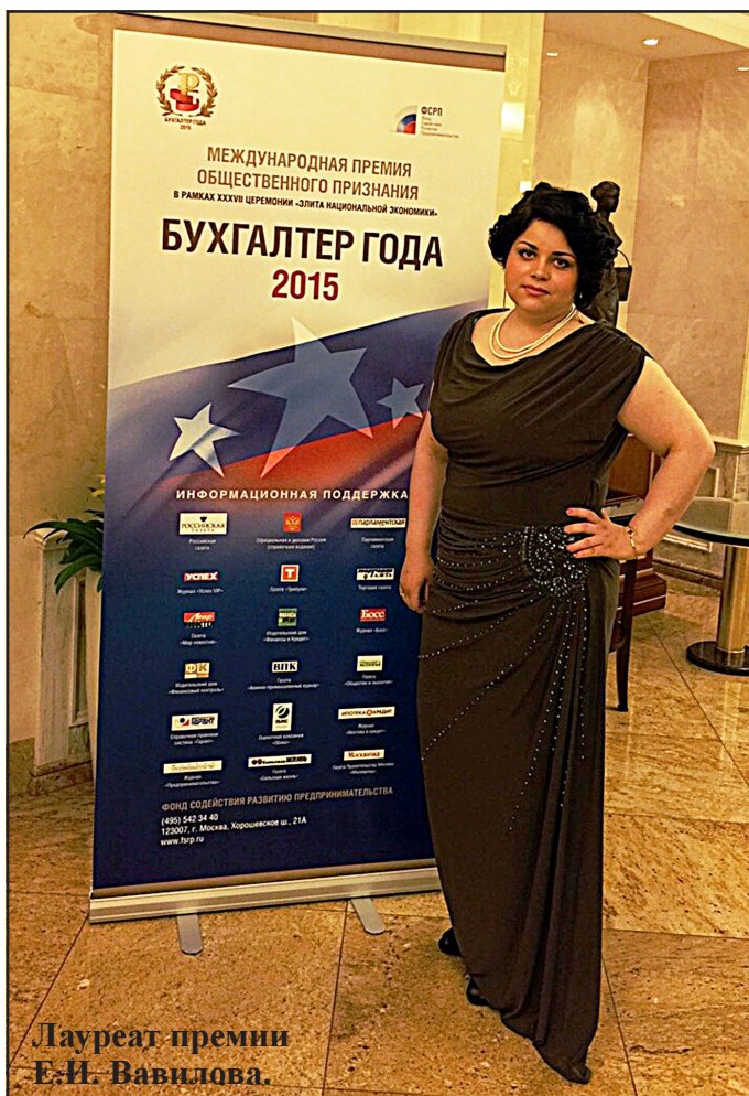
Лауреат премии Е.И. Вавилова.

- Извините, а присужденная вам премия имеет денежное выражение?