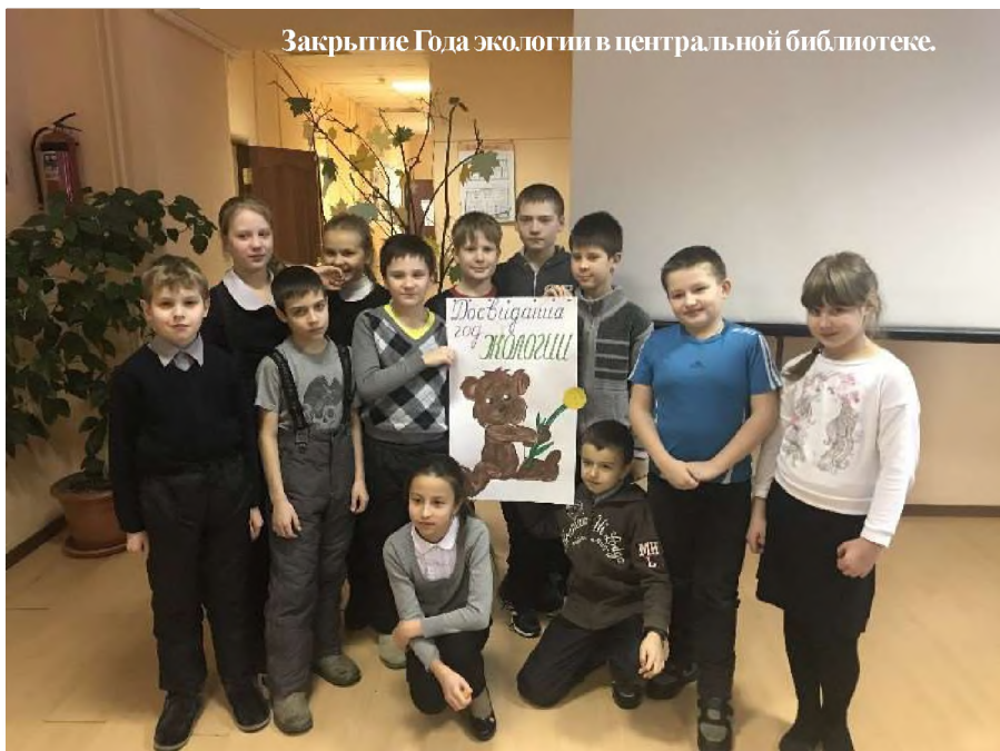
Закрытие Года экологии в центральной библиотеке.

программа включила в себя различные формы и методы работы, которая ведется с учетом возрастных особенностей читателей. Для дошкольников и младших школьников используются в основном игровые формы, для школьников среднего возраста – познавательно-развлекательные, библиографические игры, конкурсы и т. п. Для старшеклассников – познавательные с элементами дискуссий, размышлений, споров.