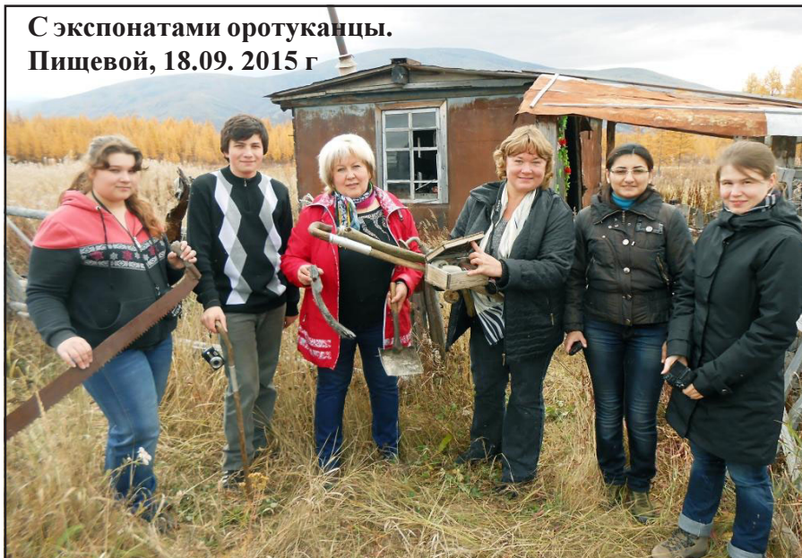
С экспонатами оротуканцы. Пищевой, 18.09. 2015 г