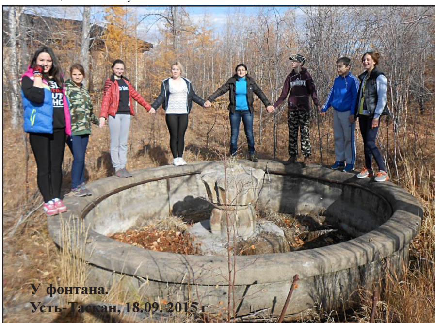
У фонтана. Усть-Таскан, 18.09. 2015 г