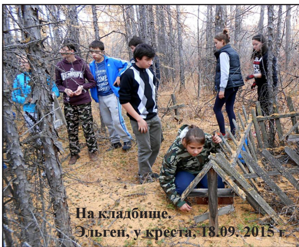
На кладбище. Эльген, у креста, 18.09. 2015 г